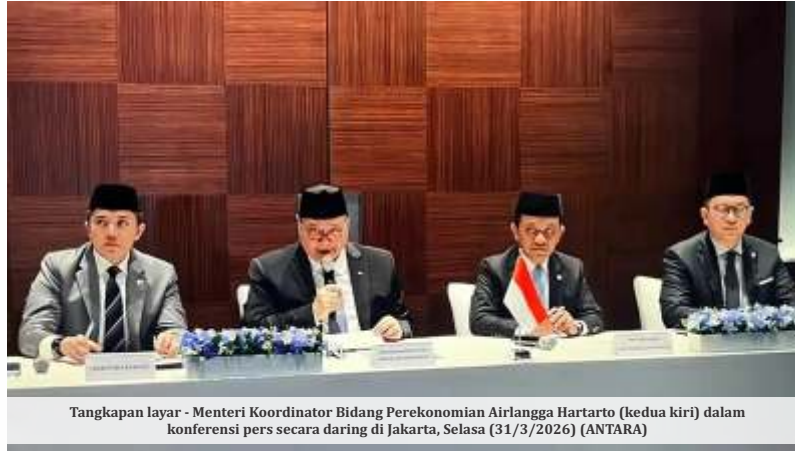
Tangkapan layar - Menteri Koordinator Bidang Perekonomian Airlangga Hartarto (kedua kiri) dalam konferensi pers secara daring di Jakarta, Selasa (31/3/2026)