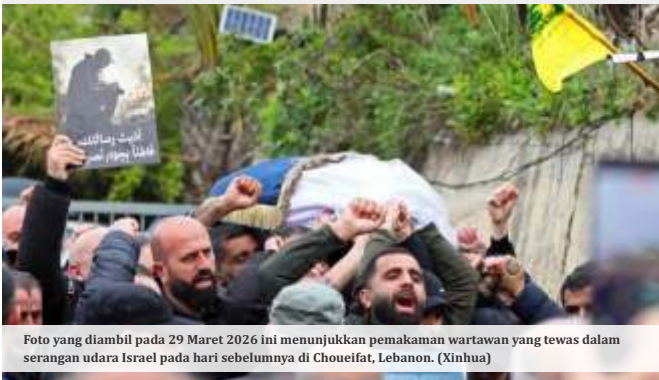
Foto yang diambil pada 29 Maret 2026 ini menunjukkan pemakaman wartawan yang tewas dalam serangan udara Israel pada hari sebelumnya di Choueifat, Lebanon.

MENTERI Luar Negeri Israel Gideon Sa'ar murka usai Perdana Menteri Spanyol Pedro Sanchez meminta Tel Aviv menghentikan permusuhan menyusul anggota TNI yang bertugas sebagai Pasukan Penjaga Perdamaian PBB di Lebanon (UNIFIL) tewas.