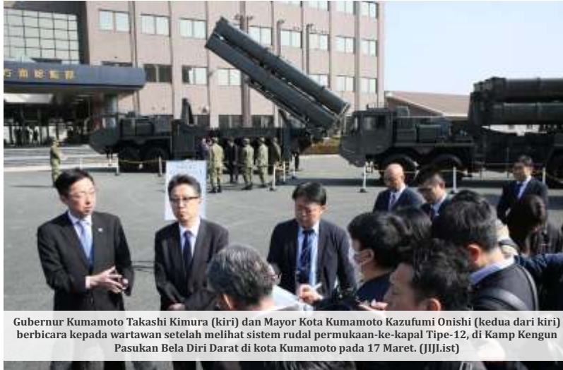
Gubernur Kumamoto Takashi Kimura (kiri) dan Mayor Kota Kumamoto Kazufumi Onishi (kedua dari kiri) berbicara kepada wartawan setelah melihat sistem rudal permukaan-ke-kapal Tipe-12, di Kamp Kengun Pasukan Bela Diri Darat di kota Kumamoto pada 17 Maret.

Sistem rudal berpemandu darat-ke-kapal tersebut memiliki jangkauan sekitar 1.000 kilometer (620 mil), sehingga sebagian wilayah daratan China dapat dijangkau -- Shanghai terletak sekitar 900 kilometer dari