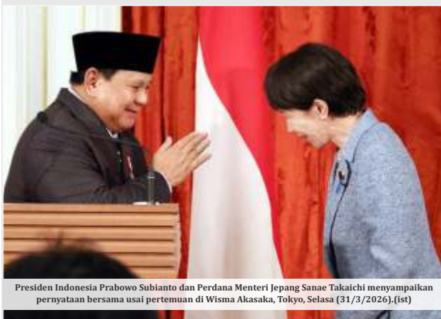
Presiden Indonesia Prabowo Subianto dan Perdana Menteri Jepang Sanae Takaichi menyampaikan pernyataan bersama usai pertemuan di Wisma Akasaka, Tokyo, Selasa (31/3/2026). (ist)

Perdana Menteri Jepang Sanae Takaichi mengungkapkan bahwa dirinya dan Presiden RI Prabowo Subianto bertukar pandangan terkait berbagai isu strategis global, mulai dari perang Iran vs Amerika Serikat-Israel di Timur Tengah hingga ketegangan di Laut China Selatan. Hal itu disampaikan dalam joint