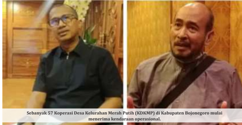
Sebanyak 57 Koperasi Desa Kelurahan Merah Putih (KDKMP) di Kabupaten Bojonegoro mulai menerima kendaraan operasional.

"Tentu KPK juga nanti akan berkoordinasi dengan otoritas di sana, sehingga saudara ASR juga bisa segera kembali ke tanah air, bisa mengikuti penyidikan perkara ini dengan baik, sehingga progres penanganan