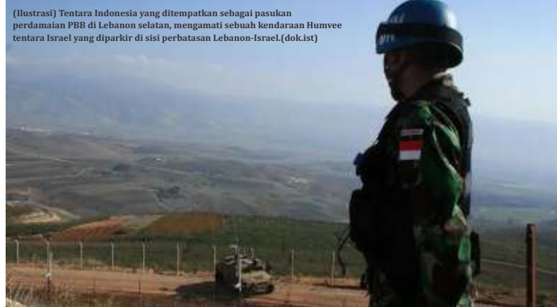
(Ilustrasi) Tentara Indonesia yang ditempatkan sebagai pasukan perdamaian PBB di Lebanon selatan, mengamati sebuah kendaraan Humvee tentara Israel yang diparkir di sisi perbatasan Lebanon-Israel.