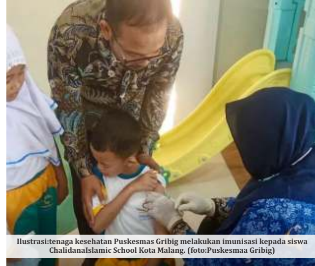
Ilustrasi: tenaga kesehatan Puskesmas Gribig melakukan imunisasi kepada siswa Chalidana Islamic School Kota Malang.

Selain itu, Husnul juga telah menginstruksikan kepada seluruh tenaga kesehatan untuk