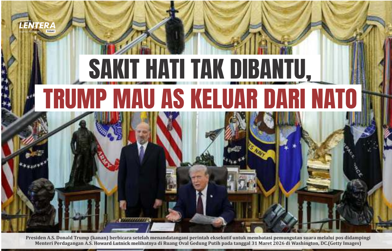
Presiden A.S. Donald Trump (kanan) berbicara setelah menandatangani perintah eksekutif untuk membatasi pemungutan suara melalui pos didampingi Menteri Perdagangan A.S. Howard Lutnick melihatnya di Ruang Oval Gedung Putih pada tanggal 31 Maret 2026 di Washington, DC.

Presiden AS Donald Trump menegaskan keseriusannya untuk menarik AS keluar dari pakta pertahanan Atlantik Utara alias NATO. Trump sakit hati dengan sekutunya di Eropa dan negara-negara anggota NATO yang enggan mengirimkan kapal perang membantu AS mengendalikan Selat Hormuz.