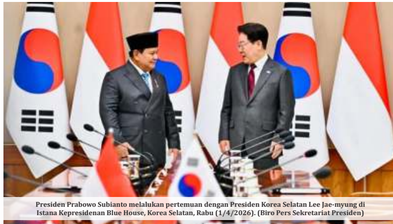
Presiden Prabowo Subianto melakukan pertemuan dengan Presiden Korea Selatan Lee Jae-myung di Istana Kepresidenan Blue House, Korea Selatan, Rabu (1/4/2026).

Prabowo juga menekankan, Indonesia dan Korea Selatan memiliki potensi yang bersifat mutualisme dalam menuju pertumbuhan ekonomi yang inklusif.