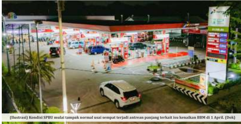
(Ilustrasi) Kondisi SPBU mulai tampak normal usai sempat terjadi antrean panjang terkait isu kenaikan BBM di 1 April. (Dok)

"[anggaran subsidi nambah] Rp90 triliun - Rp100 triliun. Itu subsidi, kompensasi lain lagi," kata Purbaya