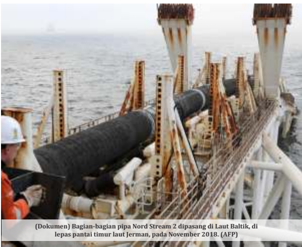
(Dokumen) Bagian-bagian pipa Nord Stream 2 dipasang di Laut Baltik, di lepas pantai timur laut Jerman, pada November 2018.

Kremlin sebelumnya juga telah bersumpah akan meningkatkan tekanan militer terhadap Kyiv sebagai respons atas serangan-serangan