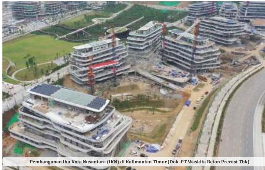
Pembangunan Ibu Kota Nusantara (IKN) di Kalimantan Timur.

Jika seluruh usulan tersebut dikabulkan pemerintah, total belanja kementerian dan lembaga pada 2027 akan melonjak menjadi sekitar Rp2.373,84 triliun. Angka tersebut meningkat sekitar Rp863 triliun atau lebih dari 57 persen dibandingkan pagu belanja kementerian dan lembaga dalam APBN 2026 yang sebesar Rp1.510,5 triliun. (tin,bis,ist/dya)