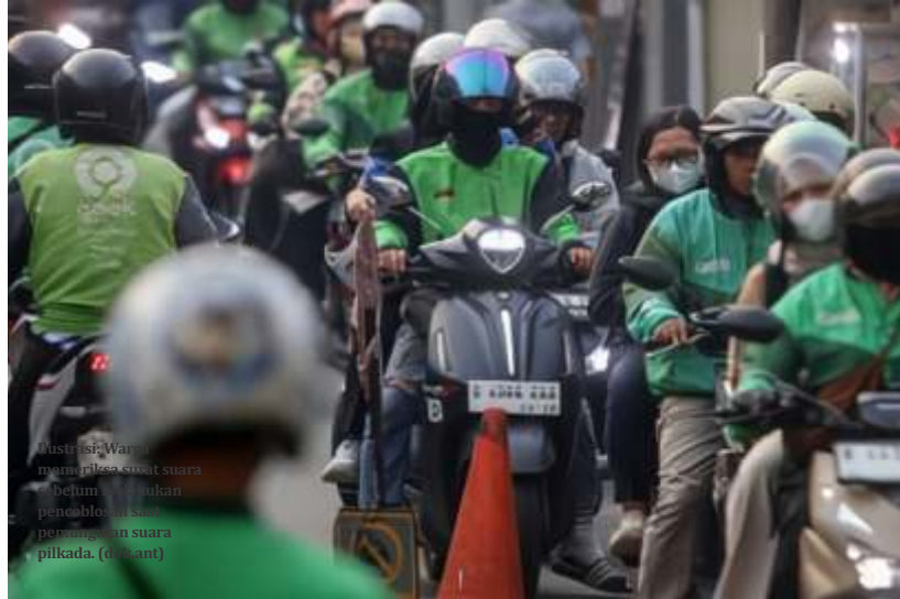
Ilustrasi: Warda memandikan suara belum terdengar peneblan komisi pengemudi suara pilkada. (diant)

"Informasi bahwa 8 persen ini memang belum mencakup untuk layanan selain penumpang. Jadi 8