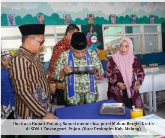
Ilustrasi: Bupati Malang, Sanusi memeriksa porsi Makan Bergizi Gratis di SDN 1 Tawangarsi, Pujon.

MALANG - Sejak diluncurkan pada Maret 2026, layanan aduan Makan Bergizi Gratis (MBG) Pemerintah Kabupaten (Pemkab) Malang telah menerima puluhan laporan. Mayoritas keluhan berkaitan dengan menu makanan yang disajikan kepada penerima manfaat.