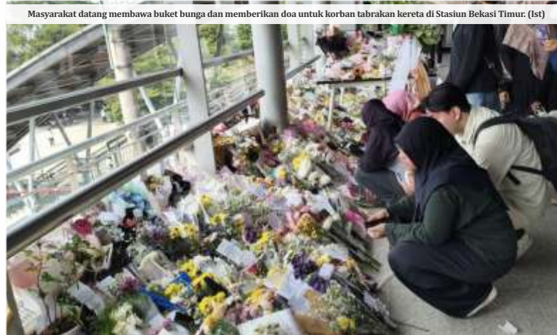
Masyarakat datang membawa buket bunga dan memberikan doa untuk korban tabrakan kereta di Stasiun Bekasi Timur.

Ia merinci, para saksi yang diperiksa berasal dari berbagai pihak, yakni pelapor, pengemudi taksi, penjaga palang pintu perlintasan,