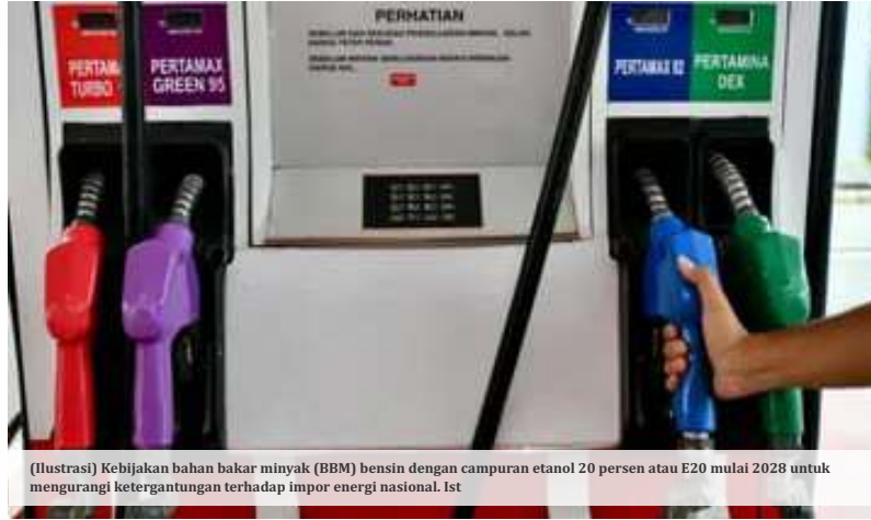
(Ilustrasi) Kebijakan bahan bakar minyak (BBM) bensin dengan campuran etanol 20 persen atau E20 mulai 2028 untuk mengurangi ketergantungan terhadap impor energi nasional.

“Kalau kita mandatori 20 persen, berarti kita kurangi impor bensin 8 juta kiloliter,” ujar Bahlil dalam keterangan tertulis, Minggu (3/5/2026). Ia menjelaskan program E20 merupakan bagian dari strategi jangka panjang pemerintah untuk memperkuat kemandirian energi nasional. Menurutnya, pola serupa sudah terlihat pada kebijakan biodiesel yang dinilai berhasil