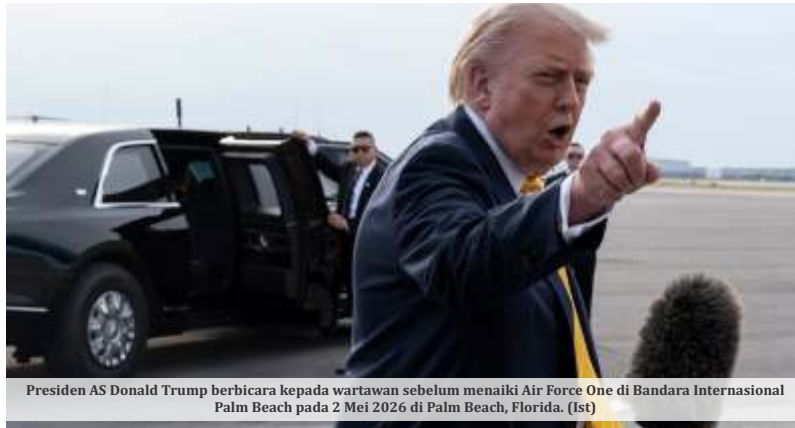
Presiden AS Donald Trump berbicara kepada wartawan sebelum menaiki Air Force One di Bandara Internasional Palm Beach pada 2 Mei 2026 di Palm Beach, Florida.

Dalam pernyataannya kepada wartawan, Trump mengatakan pembicaraan mengenai kemungkinan penyelesaian konflik masih berlangsung. Ia menyebut ada kemajuan tertentu dalam komunikasi tidak langsung dengan Teheran, namun belum yakin proposal yang diajukan akan benar-benar memenuhi kepentingan Washington. "Kami sudah