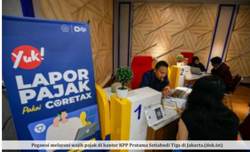
Pegawai melayani wajib pajak di kantor KPP Pratama Setiabudi Tiga di Jakarta.

Bahkan, berdasarkan pantauan pada laman Coretax DJP pada pukul 15.53 sore ini, muncul pemberitahuan bahwa sistem tengah menjalani proses