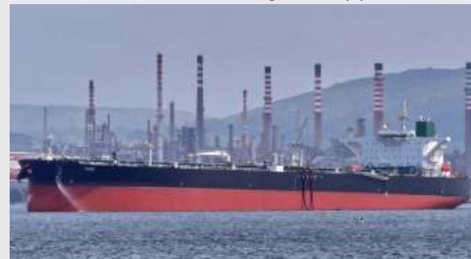
Kapal yang teridentifikasi dengan nama HUGE (9357183) milik Iran diduga berhasil menembus Selat Hormuz di tengah blokade AS.

insinyur Iran mampu menutup sumur-sumur minyak tanpa menimbulkan kerusakan serius, sehingga produksi bisa kembali ditingkatkan sewaktu-waktu bila situasi memungkinkan. (tin,ist/dya)