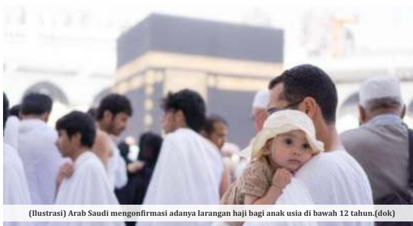
(Ilustrasi) Arab Saudi mengonfirmasi adanya larangan haji bagi anak usia di bawah 12 tahun.

Sebagaimana diketahui, ibadah haji mengharuskan seseorang berjalan jauh dari satu tempat ke tempat lainnya. Terlebih suhu panas saat