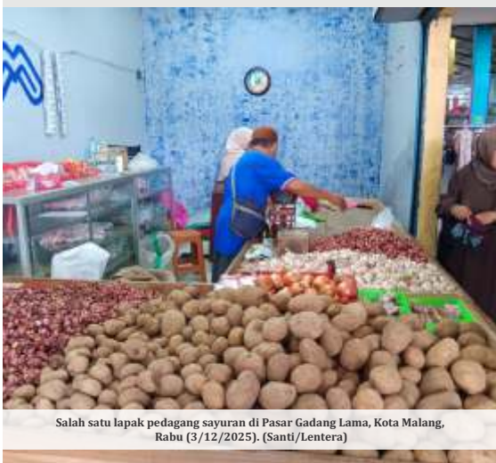
Salah satu lapak pedagang sayuran di Pasar Gadang Lama, Kota Malang, Rabu (3/12/2025).

MALANG - Musim hujan memicu kenaikan harga bawang merah di Pasar Gadang Lama, Kota Malang. Saat ini, harga komoditas tersebut tembus Rp48 ribu per kilogramnya (Kg). Lonjakan harga terpantau sejak 28 November lalu, atau menjelang Natal 2025 dan Tahun Baru (Nataru) 2026.