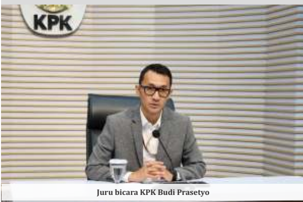
Juru bicara KPK Budi Prasetyo

J uru bicara KPK Budi Prasetyo menyebut pihaknya sudah melakukan pencegahan ke luar negeri terhadap beberapa pihak dalam perkara dugaan korupsi kuota haji. Pencegahan ke luar negeri ditetapkan untuk mengusut otak atau mastermind dalam perkara kuota haji ini.