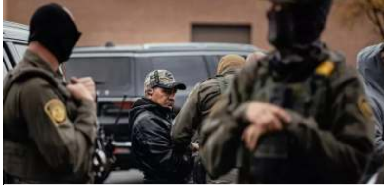
Imigran diperiksa di tempat parkir di sisi paling utara kota sebelum dipindahkan ke fasilitas Imigrasi dan Bea Cukai pada 31 Oktober 2025, di Chicago, Illinois.

"Di Somalia, mereka tidak punya apa-apa, mereka hanya berkeliaran saling membunuh," kata Trump dalam rapat kabinet di Gedung Putih pada Selasa (2/12/2025) waktu setempat,