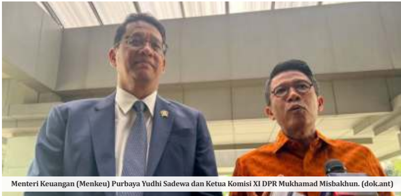
Menteri Keuangan (Menkeu) Purbaya Yudhi Sadewa dan Ketua Komisi XI DPR Mukhamad Misbakhun.

Sebagaimana diketahui, dalam draf yang beredar beberapa waktu ke belakang, revisi UU tersebut setidaknya menambah dan mengubah sejumlah aspek yang cukup krusial mengenai pengendalian lembaga Komite Sistem Stabilitas Keuangan