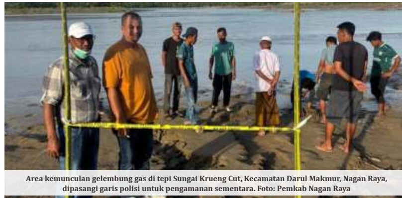
Area kemunculan gelembung gas di tepi Sungai Krueng Cut, Kecamatan Darul Makmur, Nagan Raya, dipasangi garis polisi untuk pengamanan sementara.

Sementara, Pemerintah Kabupaten Aceh Utara mulai mempersiapkan pembangunan hunian tetap bagi warga yang kehilangan rumah akibat banjir besar