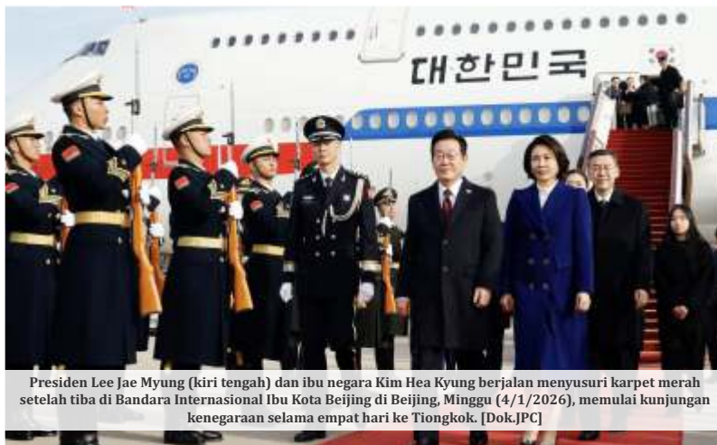
Presiden Lee Jae Myung (kiri tengah) dan ibu negara Kim Hea Kyung berjalan menyusuri karpet merah setelah tiba di Bandara Internasional Ibu Kota Beijing di Beijing, Minggu (4/1/2026), memulai kunjungan kenegaraan selama empat hari ke Tiongkok.

Kunjungan Lee juga terjadi pada saat yang sensitif bagi diplomasi regional. Hubungan antara Tiongkok dan Jepang telah memburuk tajam dan ketegangan atas Taiwan terus memanas.