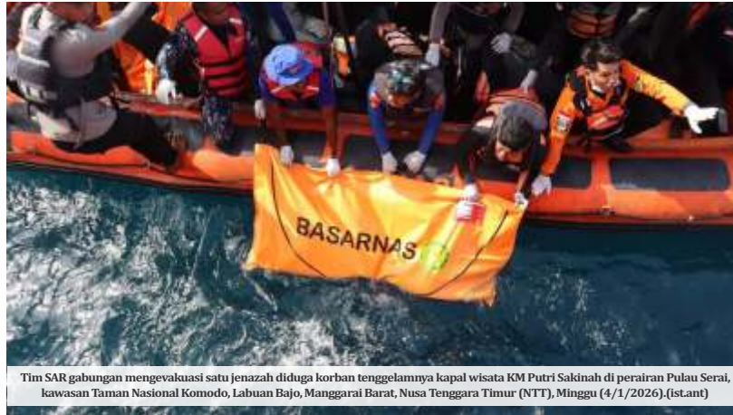
Tim SAR gabungan mengevakuasi satu jenazah diduga korban tenggelamnya kapal wisata KM Putri Sakinah di perairan Pulau Serai, kawasan Taman Nasional Komodo, Labuan Bajo, Manggarai Barat, Nusa Tenggara Timur (NTT), Minggu (4/1/2026).