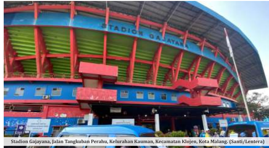
Stadion Gajayana, Jalan Tangkuban Perahu, Kelurahan Kauman, Kecamatan Klojen, Kota Malang.

rencana pembangunan museum ini masih berada pada tahap awal. Aspek teknis, termasuk lokasi pasti di dalam kawasan stadion dan desain museum, belum ditentukan.