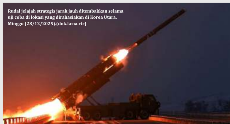
Rudal jelajah strategis jarak jauh ditembakkan selama uji coba di lokasi yang dirahasiakan di Korea Utara, Minggu (28/12/2025).

KOREA Utara (Korut) kembali memanaskan situasi kawasan dengan menembakkan dua rudal balistik tak teridentifikasi ke arah perairan di lepas pantai timurnya pada Minggu (4/1/2026). Aksi provokasi ini dilakukan tepat sehari sebelum para pemimpin Korea Selatan (Korsel) dan China dijadwalkan menggelar pertemuan puncak di Beijing.