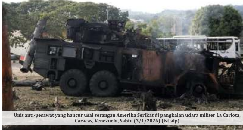
Unit anti-pesawat yang hancur usai serangan Amerika Serikat di pangkalan udara militer La Carlota, Caracas, Venezuela, Sabtu (3/1/2026).

Sejumlah media internasional sebelumnya melaporkan adanya ledakan di Caracas dan menyebut operasi tersebut melibatkan pasukan elite Amerika Serikat. Hingga kini, belum ada konfirmasi independen yang dapat memverifikasi laporan tersebut.