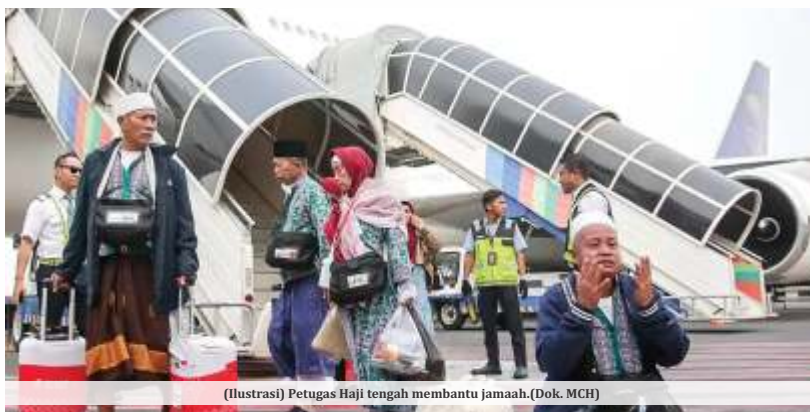
(Ilustrasi) Petugas Haji tengah membantu jama'ah.

"Komnas Haji mengusulkan. Pertama, melakukan sosialisasi lebih masif kepada masyarakat melalui jenjang struktural birokrasi maupun kultural, baik secara langsung maupun