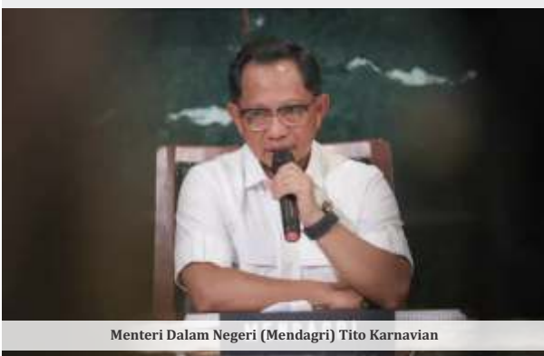
Menteri Dalam Negeri (Mendagri) Tito Karnavian

MENTERI Dalam Negeri (Mendagri) Tito Karnavian melarang kepala daerah izin pergi ke luar negeri selama periode Natal dan Tahun Baru 2026. Ia meminta agar para kepala daerah fokus di daerahnya.