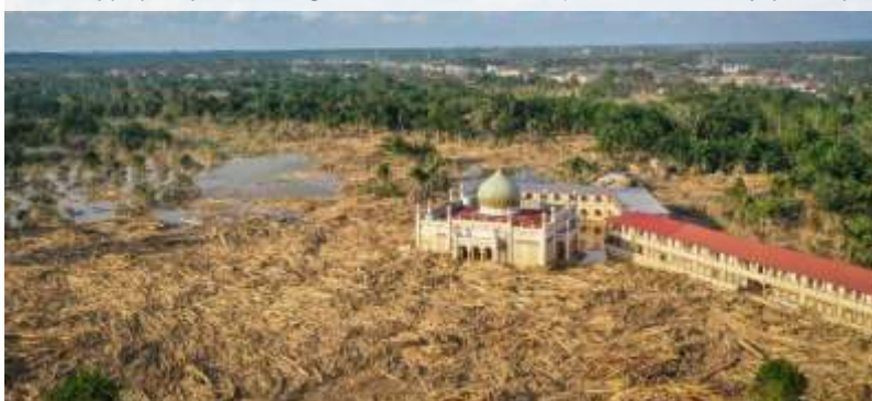
Foto udara menampilkan tumpukan kayu-kayu memenuhi area Pondok Pesantren Darul Mukhlisin pascabanjir bandang di Desa Tanjung Karang, Karang Baru, Kabupaten Aceh Tamiang, Aceh, Jumat (5/12/2025). Aceh Tamiang Disebut Kota Zombie usai Banjir, Ini 5 Fakta Kondisinya

sanksinya ada di Pasal 77, yaitu selama 3 bulan dilakukan pemberhentian sementara," ucap dia.