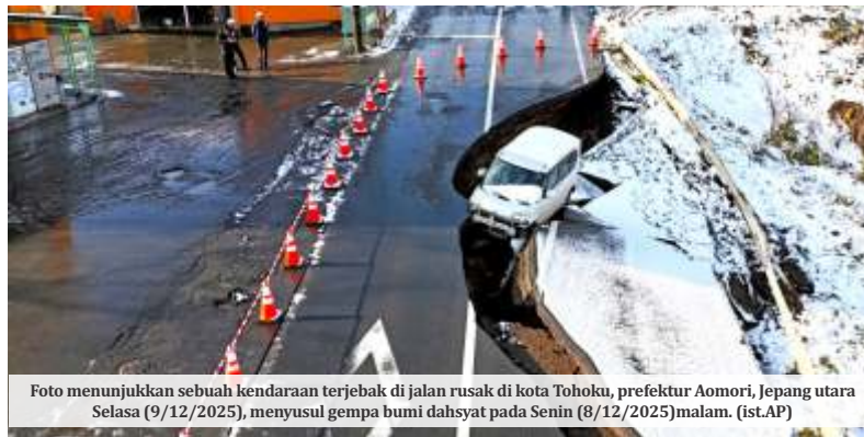
Foto menunjukkan sebuah kendaraan terjebak di jalan rusak di kota Tohoku, prefektur Aomori, Jepang utara Selasa (9/12/2025), menyusul gempa bumi dahsyat pada Senin (8/12/2025) malam.

Perdana Menteri Jepang Sanae Takaichi pada Selasa (9/12/2025) mengonfirmasi bahwa sedikitnya 30 orang terluka akibat guncangan hebat gempa magnitudo 7,5 yang melanda wilayah timur laut negaranya pada Senin (8/12/2025) malam. Tak hanya itu, Takaichi juga melontarkan peringatan keras agar masyarakat bersiap menghadapi potensi gempa serupa atau bahkan lebih kuat yang bisa terjadi sewaktu-waktu di sepanjang pesisir Pasifik. Pasalnya, Badan Meteorologi Jepang (JMA), Selasa (9/12/2025), tercatat lebih dari 10 gempa susulan menghantam dalam kurun waktu hanya 14 jam setelah guncangan utama.