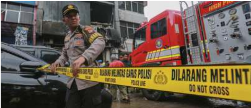
Tercatat total ada 22 korban meninggal dunia dan 54 orang selamat dalam insiden kebakaran Gedung Terra Drone di Cempaka Baru, Kemayoran, Jakarta Pusat, Selasa (9/12/2025).

Sebelumnya diberitakan, total ada 22 pegawai yang meninggal dunia dalam insiden itu. Mereka sudah