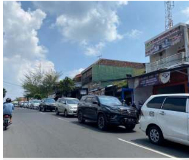
Ilustrasi: ruas jalan di Kecamatan Karangploso, Kabupaten Malang.

Karena itu, Oong menegaskan, DPUBM mengedepankan perencanaan berbasis data aktual di lapangan sebelum menentukan skala prioritas perbaikan. Pendekatan ini dinilai penting agar pelaksanaan kegiatan tidak meleset dari