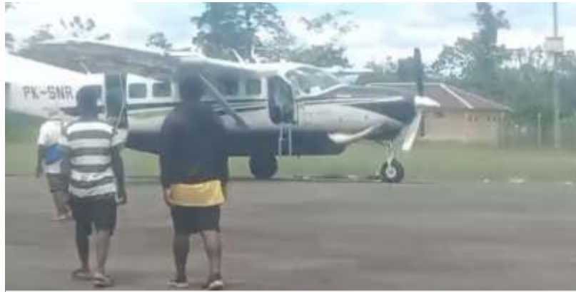
Tampak Pesawat Smart Air dengan nomor registrasi PK-SNR masih berada di Lapangan Terbang Korowai. (Ist)

Data yang diterima memuat dua titik koordinat GPS: S 5,214472° T 140,016460° dan S 5,214139° T 140,016718°. Pada pukul 11.32 WIT,