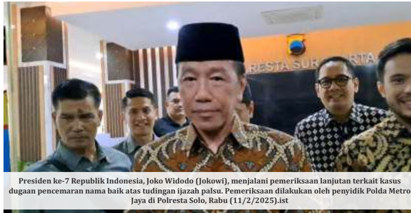
Presiden ke-7 Republik Indonesia, Joko Widodo (Jokowi), menjalani pemeriksaan lanjutan terkait kasus dugaan pencemaran nama baik atas tuduhan ijazah palsu. Pemeriksaan dilakukan oleh penyidik Polda Metro Jaya di Polresta Solo, Rabu (11/2/2025).ist

Yakup menyebut, dalam pemeriksaan tersebut Jokowi memberikan penjelasan detail atas setiap pertanyaan penyidik. Keterangan tambahan ini, menurut dia, akan menjadi bagian dari berkas perkara yang sedang disusun sebelum dilimpahkan ke kejaksaaan. "Tentunya