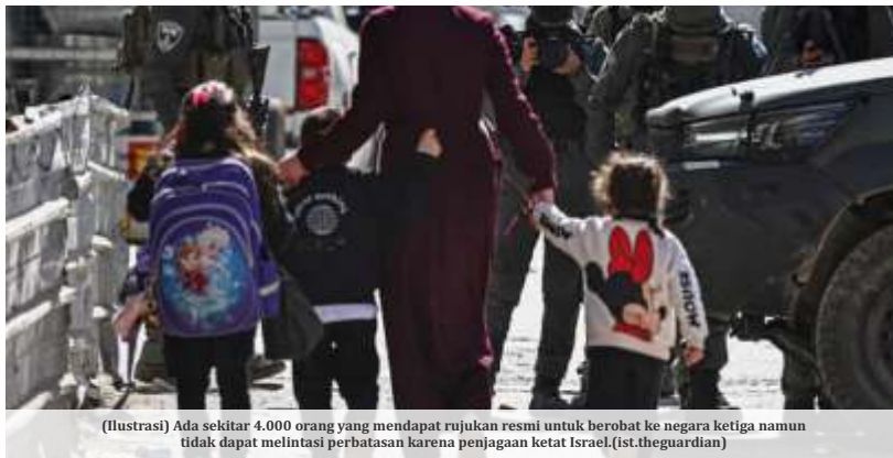
(Ilustrasi) Ada sekitar 4.000 orang yang mendapat rujukan resmi untuk berobat ke negara ketiga namun tidak dapat melintasi perbatasan karena penjagaan ketat Israel.

Laporan serupa dimuat Ynetnews dalam artikel berjudul "Indonesia prepares up to 8,000 troops for possible Gaza mission, first state to signal