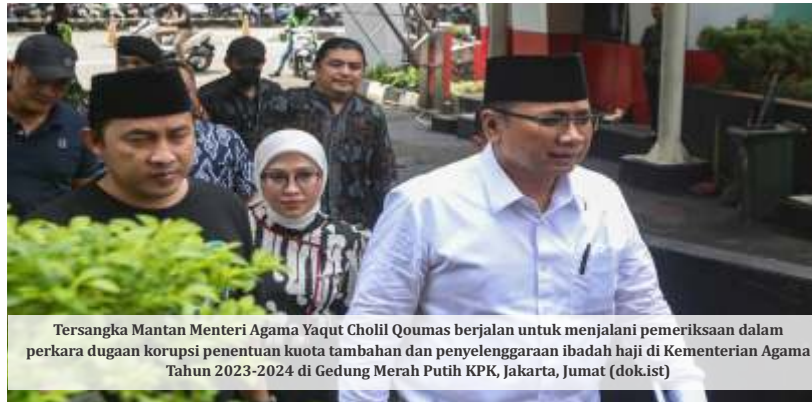
Tersangka Mantan Menteri Agama Yaqut Cholil Qoumas berjalan untuk menjalani pemeriksaan dalam perkara dugaan korupsi penentuan kuota tambahan dan penyelenggaraan ibadah haji di Kementerian Agama Tahun 2023-2024 di Gedung Merah Putih KPK, Jakarta, Jumat