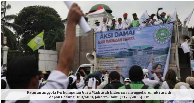
Ratusan anggota Perkumpulan Guru Madrasah Indonesia menggelar unjuk rasa d depan Gedung DPR/MPR, Jakarta, Rabu (11/2/2026).

“Salah satu hal yang perlu mendapatkan atensi, yang pertama Ibu Pimpinan, kami guru swasta mau ikut seleksi ASN saja, mau ikut PPPK saja tidak bisa, Bapak, Ibu. Karena