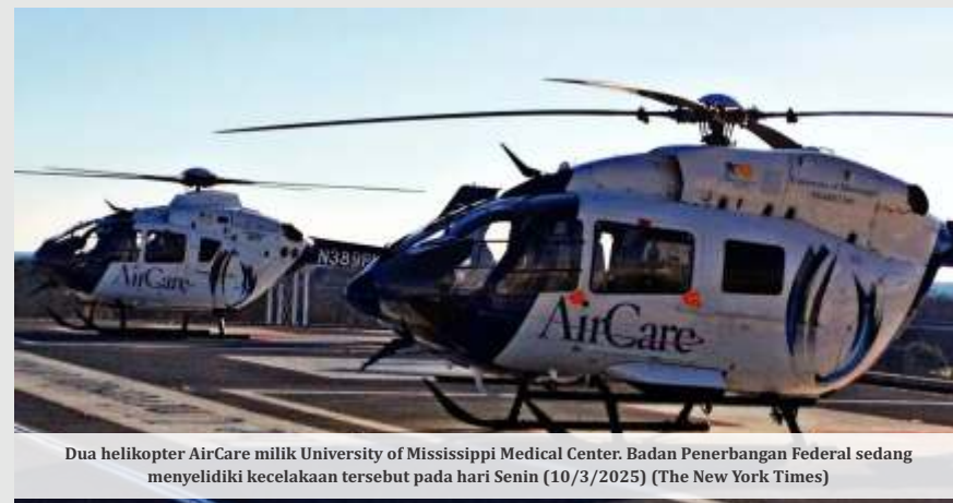
Dua helikopter AirCare milik University of Mississippi Medical Center. Badan Penerbangan Federal sedang menyelidiki kecelakaan tersebut pada hari Senin (10/3/2025)

"Negara bagian kita tidak akan pernah melupakan pengorbanan para pahlawan ini," ujarnya.