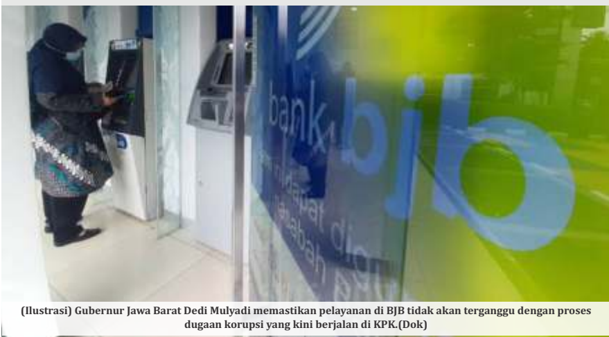
(Ilustrasi) Gubernur Jawa Barat Dedi Mulyadi memastikan pelayanan di BJB tidak akan terganggu dengan proses dugaan korupsi yang kini berjalan di KPK.

JAKARTA - Komisi Pemberantasan Korupsi (KPK) membuka peluang memanggil eks Gubernur Jawa Barat Ridwan Kamil (RK) alias Emil untuk diperiksa sebagai saksi terkait kasus dugaan korupsi dana iklan Bank Pembangunan Daerah Jawa Barat dan Banten (BJB).