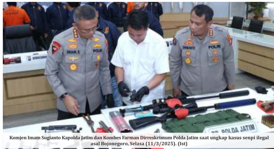
Komjen Imam Sugianto Kapolda Jatim dan Kombes Farman Dirreskrimum Polda Jatim saat ungkap kasus senpi ilegal asal Bojonegoro, Selasa (11/3/2025). (Ist)

Kasus ini merupakan hasil pengungkapan yang melibatkan tiga wilayah, yaitu Polda Papua, Polda Jatim, dan Polda DIY. Pengungkapan bermula dari operasi yang dilakukan Satgas Operasi Damai Cartenz-2025 bersama Polda Papua pada Rabu