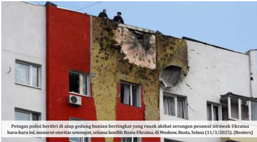
Petugas polisi berdiri di atap gedung hunian bertingkat yang rusak akibat serangan pesawat nirawak Ukraina baru-baru ini, menurut otoritas setempat, selama konflik Rusia-Ukraina, di Moskow, Rusia, Selasa (11/3/2025).

MOSKOW - Ukraina melancarkan serangan besar-besaran dengan drone ke Moskow, ibu kota Rusia, dan otoritas Rusia menyatakan bahwa puluhan drone tersebut berhasil ditembak jatuh oleh sistem pertahanan mereka.