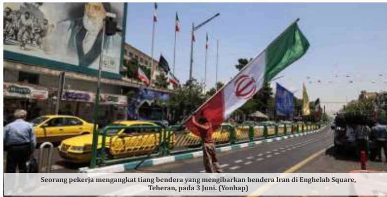
Seorang pekerja mengangkat tiang bendera yang mengibarkan bendera Iran di Enghelab Square, Teheran, pada 3 Juni.

Selain itu, Iran juga dituduh berada di balik serangkaian serangan yang terjadi di Eropa dengan sasaran komunitas Yahudi serta jurnalis Iran dan Amerika Serikat. Serangan-serangan tersebut diklaim dilakukan