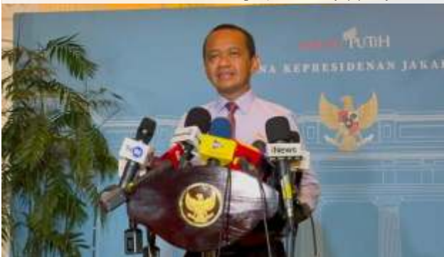
Menteri ESDM Bahlil Lahadalia di Istana Negara, Jakarta, Kamis (11/6/2026).

pembangkit listrik nasional masih dalam kondisi aman dan tidak menjadi penyebab gangguan yang terjadi di sejumlah wilayah.