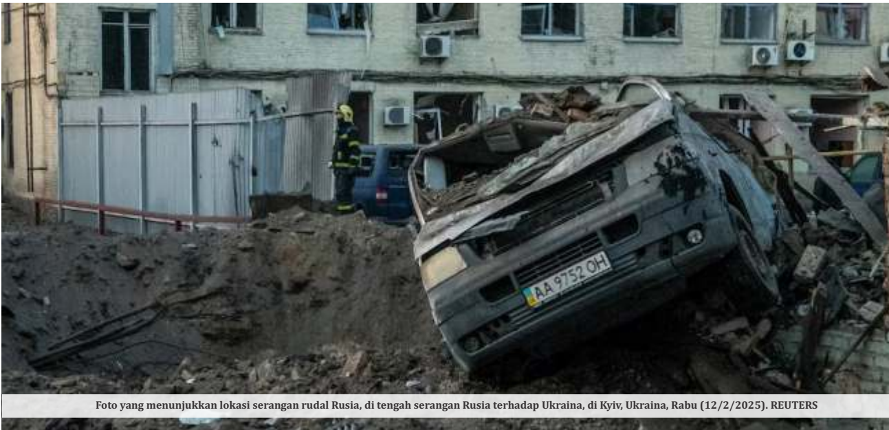
Foto yang menunjukkan lokasi serangan rudal Rusia, di tengah serangan Rusia terhadap Ukraina, di Kyiv, Ukraina, Rabu (12/2/2025).

KYIV - Presiden Ukraina Volodymyr Zelensky menyatakan siap menukar tanah dalam negosiasi dengan Rusia. Negosiasi itu sebagai bagian dari pembebasan seorang tahanan Amerika serta isyarat dari Presiden AS Donald Trump guna mengakhiri perang.