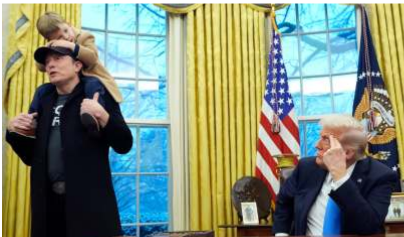
Bos X sekaligus kepala Departemen Efisiensi Amerika Serikat Elon Musk membawa anaknya, X Æ A-12 atau Lil X, saat menemui Presiden Donald Trump di Gedung Putih.

Peran Musk di pemerintahan dan juga bisnis menghadapi kritik. Kritik muncul lantaran perusahaannya telah memiliki kontrak besar dengan pemerintah AS.