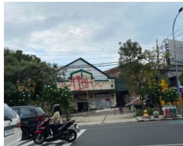
Lahan parkir di Jalan Basuki Rahmat, koridor Kayutangan Heritage Kota Malang.

persegi. Bangunan bagian depan akan tetap dipertahankan sebagai cagar budaya, sementara bagian belakangnya akan dibuat parkir bertingkat. Nantinya, akan ada konektivitas dengan parkir di Jalan Majapahit, sehingga aset Pemda dapat dimanfaatkan secara optimal," terangnya. (Santi/Dya)