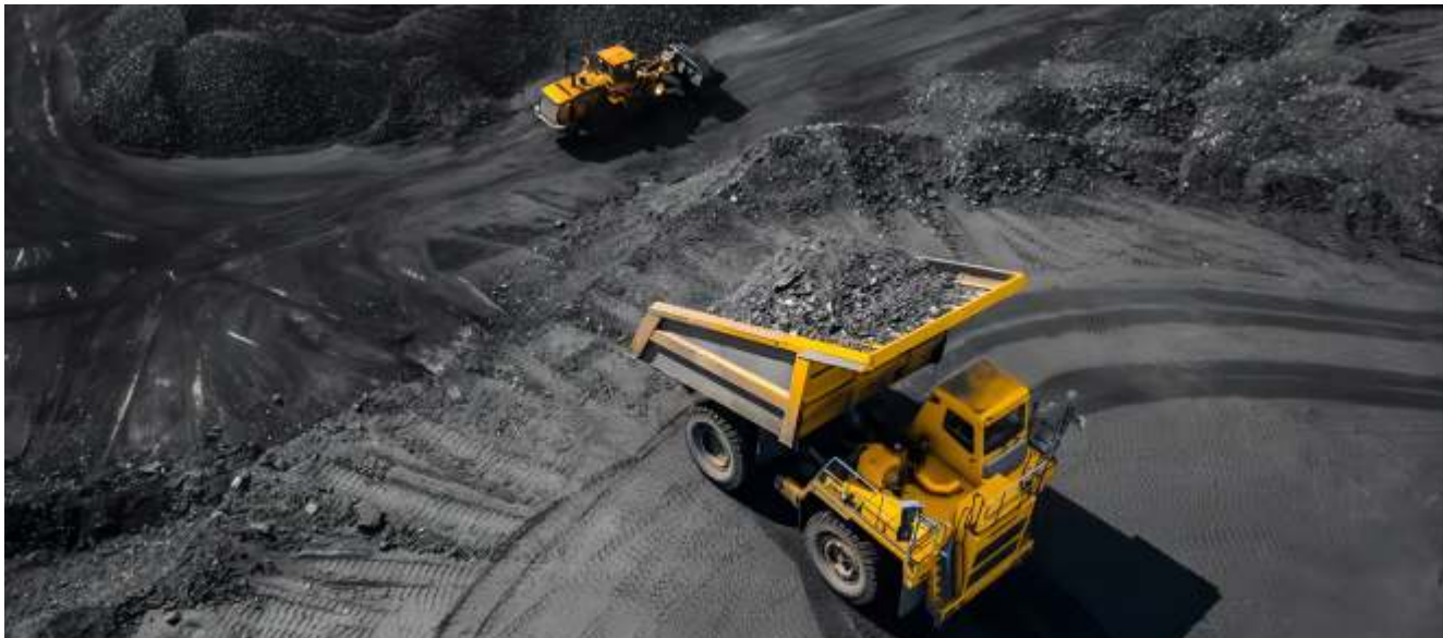
(Ilustrasi) Pengaturan terkait dengan penetapan wilayah izin usaha pertambangan (WIUP) mineral, logam, dan batu bara menjadi salah satu bahasan Revisi UU Minerba.

JAKARTA - Badan Legislasi (Beleg) DPR mengebut revisi Undang-Undang tentang Mineral dan Batu Bara (UU Minerba). Usai menerima Daftar Investarisasi Masalah (DIM) dari pemerintah dan Dewan Perwakilan Daerah (DPD), Rabu (12/2/2025) malam rapat dilanjutkan.