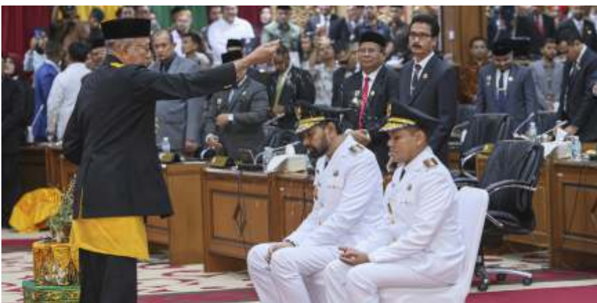
Usai dilantik Mendagri Tito, Wali Nanggroe Aceh Tgk Malik Mahmud Al Haytar melakukan peusujuk (tradisi adat Aceh) kepada Gubernur dan Wakil Gubernur Aceh Muzakir Manaf (kedua kanan) dan Fadhullah.

Bagi kendaraan yang sudah mendaftar di jatah pengisiannya yaitu 120 liter per hari. Namun jika tidak menggunakan barcode, kendaraan tidak dilayani untuk mengisi BBM subsidi di SPBU.(wid, rtr, din, ist/dya)