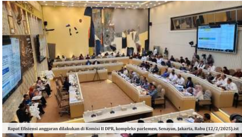
Rapat Efisiensi anggaran dilakukan di Komisi II DPR, kompleks parlemen, Senayan, Jakarta, Rabu (12/2/2025).ist

"OIKN mengusulkan anggaran tambahan TA (tahun anggaran) 2025 sebesar Rp8,1 triliun untuk membangun kompleks legislatif, yudikatif, dan ekosistem pendukungnya, serta membuka akses