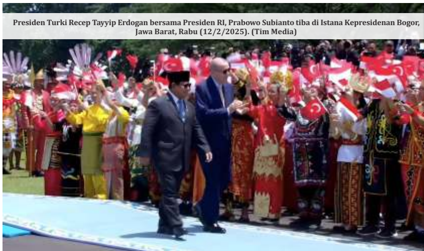
Presiden Turki Recep Tayyip Erdogan bersama Presiden RI, Prabowo Subianto tiba di Istana Kepresidenan Bogor, Jawa Barat, Rabu (12/2/2025).

"Kami juga berkomitmen untuk ikut serta dalam pembangunan proyek IKN Nusantara dengan melibatkan