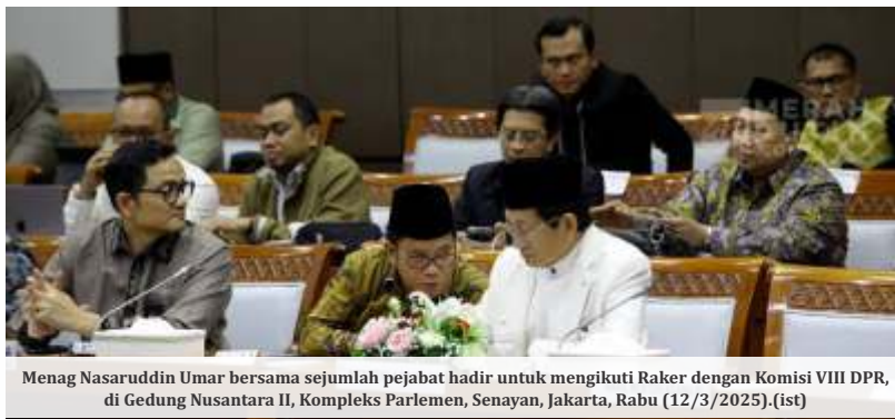
Menag Nasaruddin Umar bersama sejumlah pejabat hadir untuk mengikuti Raker dengan Komisi VIII DPR, di Gedung Nusantara II, Kompleks Parlemen, Senayan, Jakarta, Rabu (12/3/2025).

"Masa kerja kita terpotong libur panjang Idul Fitri maka itu kami minta pihak terkait tidak ada libur. Kami akan bersama-sama dengan teman-teman semuanya, tidak ada sedikit pun lubang yang muncul nanti akan datang. Kalau kita sudah berikhtiar masih juga ada kelemahan, itulah takdir," jelas dia.