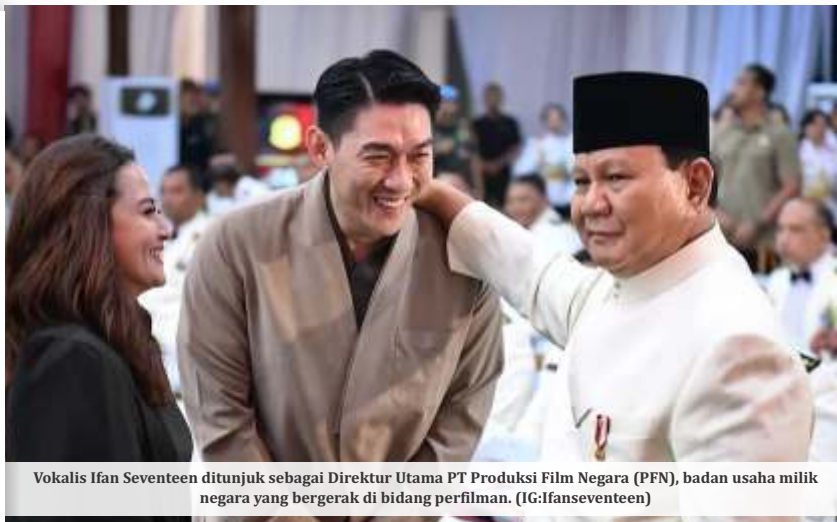
Vokalis Ifan Seventeen ditunjuk sebagai Direktur Utama PT Produksi Film Negara (PFN), badan usaha milik negara yang bergerak di bidang perfilman. (IG:ifanseventeen)