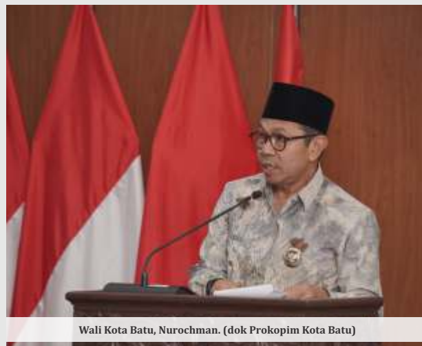
Wali Kota Batu, Nurochman.

Pemkot Batu juga merancang berbagai program kesejahteraan masyarakat, termasuk subsidi air bersih dan listrik bagi warga pra sejahtera, insentif bagi tenaga keagamaan dan petugas pelayanan publik, serta program 1.000 sarjana per tahun.