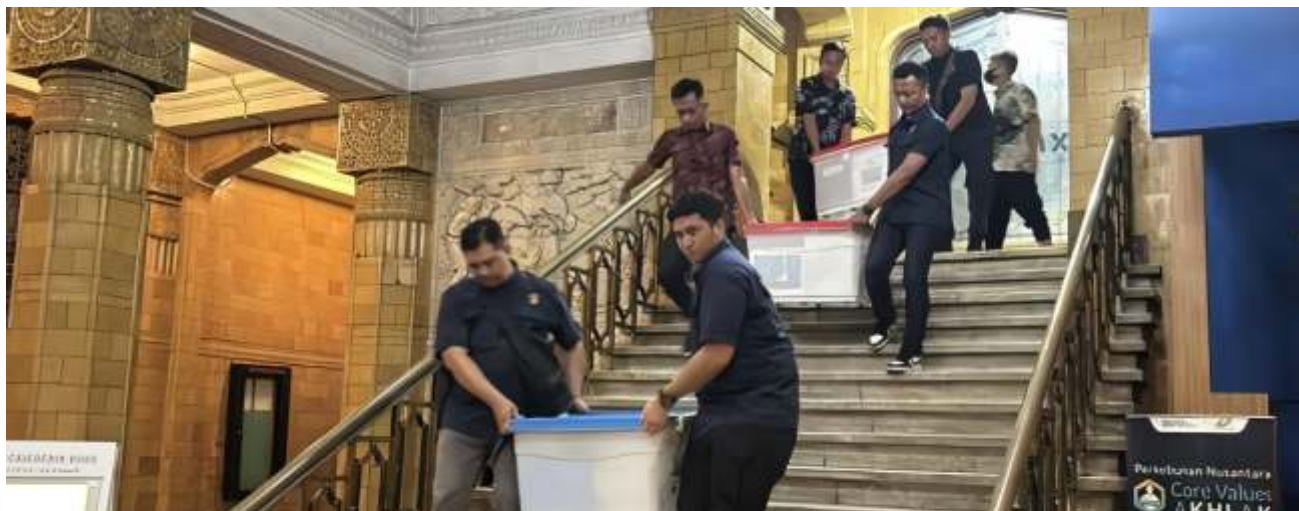
Penyidik Korps Pemberantas Tindak Pidana Korupsi (Kortas Tipikor) Bareskrim Mabes Polri mengamankan sejumlah dokumen usai menggeledah Kantor PTPN I Regional 4 Surabaya selama 11 jam pada Rabu (12/3/2025).

Begitu menyelesaikan pengeledahan dan pemeriksaan, penyidik membawa 6 box yang diangkut dari lantai 2 kemudian diturunkan untuk dimasukkan ke dalam dua mobil innova.