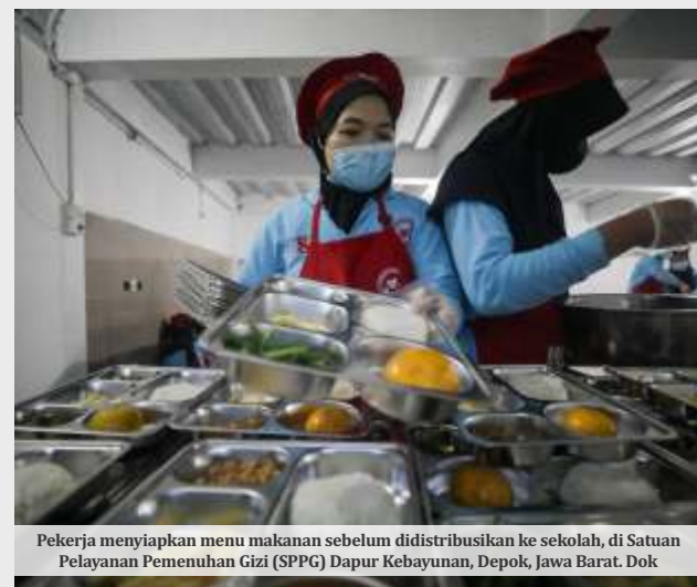
Pekerja menyiapkan menu makanan sebelum didistribusikan ke sekolah, di Satuan Pelayanan Pemenuhan Gizi (SPPG) Dapur Kebayunan, Depok, Jawa Barat. Dok

Provinsi Sumatera Barat menjadi salah satu wilayah dengan jumlah SPPG cukup besar, yakni mencapai 404 unit layanan. Selain menyasar