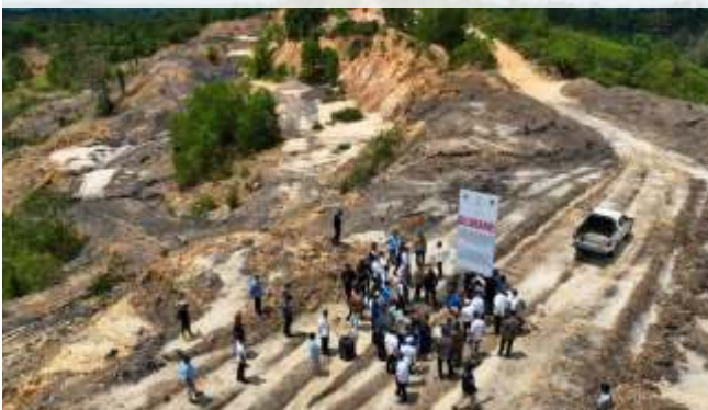
Satgas penanggulangan aktivitas ilegal di wilayah IKN beberapa waktu lalu mendarangi kawasan Tahura Bukit Soeharto.

sudah dilakukan sejak 2023 melalui pembentukan Satuan Tugas Penanggulangan Aktivitas Ilegal Wilayah IKN yang melibatkan lintas kementerian, aparat keamanan, hingga pemerintah daerah.