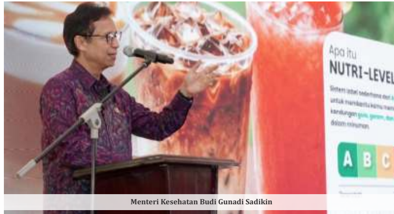
Menteri Kesehatan Budi Gunadi Sadikin

Menurut dia, pihak pelapor telah menyerahkan sekitar 10 barang bukti