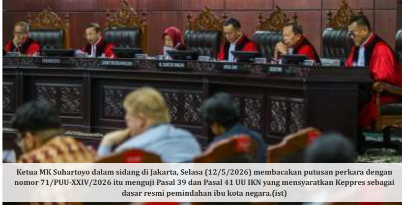
Ketua MK Suhartoyo dalam sidang di Jakarta, Selasa (12/5/2026) membacakan putusan perkara dengan nomor 71/PUU-XXIV/2026 itu menguji Pasal 39 dan Pasal 41 UU IKN yang mensyaratkan Keppres sebagai dasar resmi pemindahan ibu kota negara.

Menurut pemohon, terdapat ketidaksinkronan antara Pasal 2 ayat (1) UU DKJ dan Pasal 39 ayat (1) UU IKN. Dalam UU DKJ disebutkan bahwa Provinsi Daerah Khusus Ibukota Jakarta diubah menjadi Provinsi Daerah Khusus Jakarta. Sementara dalam UU IKN ditegaskan bahwa kedudukan, fungsi, dan peran ibu kota