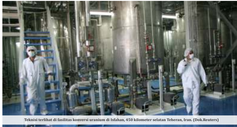
Teknisi terlihat di fasilitas konversi uranium di Isfahan, 450 kilometer selatan Teheran, Iran.

Ketegangan geopolitik antara Iran dan Amerika Serikat (AS) kembali memanas dalam beberapa hari terakhir. Situasi ini dipicu setelah Ketua Parlemen Iran, Mohammad Bagher Ghalibaf, mengeluarkan ultimatum keras kepada Washington agar menerima proposal perdamaian 14 poin yang diajukan Teheran. Jika proposal tersebut kembali ditolak, Iran menegaskan bahwa Amerika Serikat hanya akan menghadapi “kegagalan demi kegagalan” dalam konflik yang kini telah berlangsung lebih dari dua bulan.