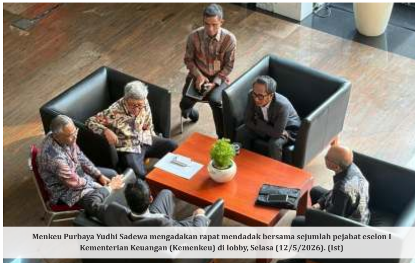
Menkeu Purbaya Yudhi Sadewa mengadakan rapat mendadak bersama sejumlah pejabat eselon I Kementerian Keuangan (Kemenkeu) di lobby, Selasa (12/5/2026).

Bank Indonesia turut mengakui pelemahan rupiah dipengaruhi kombinasi faktor global dan domestik.