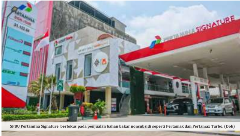
SPBU Pertamina Signature berfokus pada penjualan bahan bakar nonsubsidi seperti Pertamina dan Pertamina Turbo.

Pemerintah mulai menyiapkan langkah besar untuk menata ulang kebijakan subsidi energi di tengah tekanan ekonomi global dan ancaman kenaikan harga energi dunia. Salah satu opsi yang kini dibahas serius ialah pembatasan pembelian bahan bakar minyak (BBM) subsidi seperti Pertalite dan Solar berdasarkan jenis kendaraan dan kapasitas mesin kendaraan atau CC.