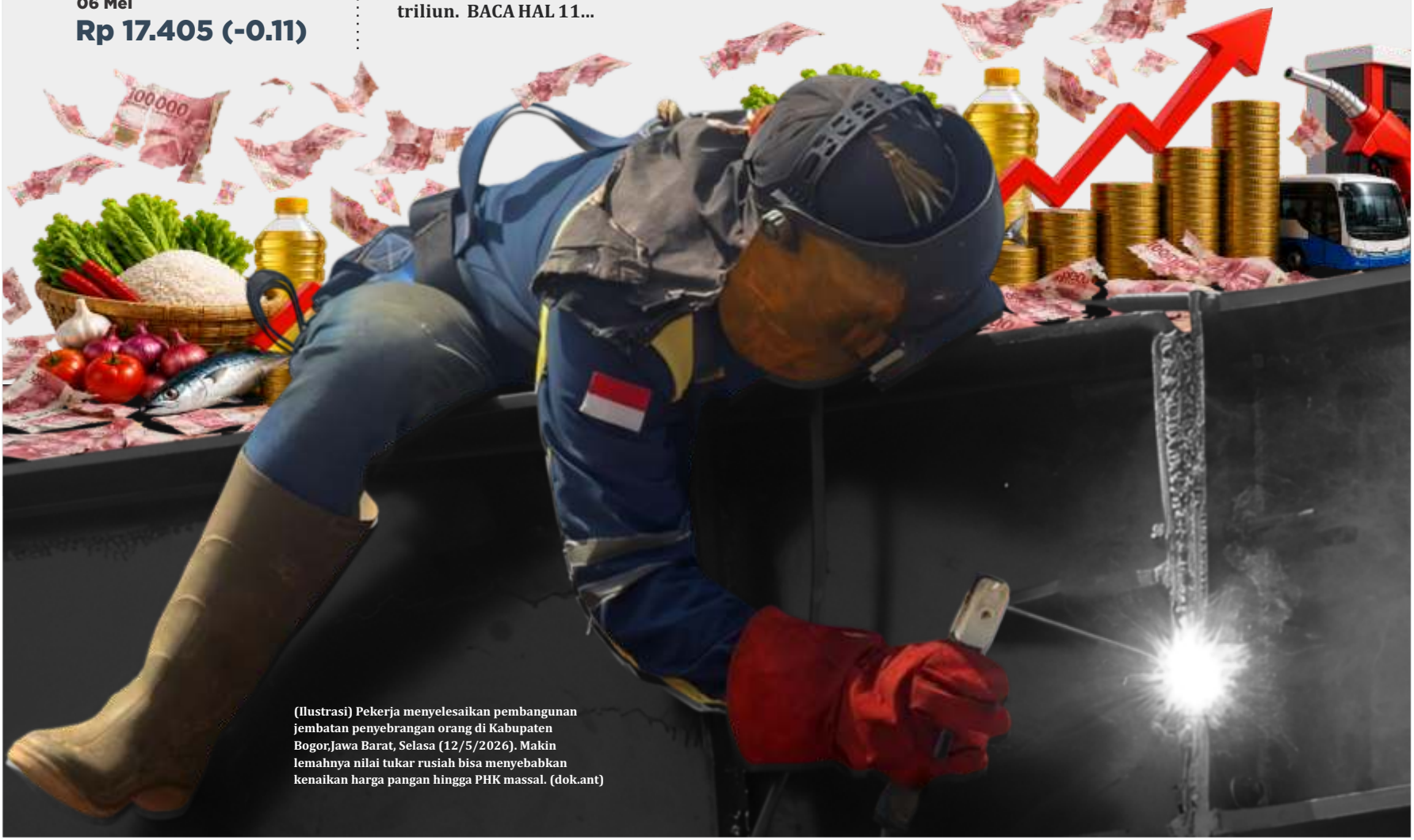
(Ilustrasi) Pekerja menyelesaikan pembangunan jembatan penyebrangan orang di Kabupaten Bogor Jawa Barat, Selasa (12/5/2026). Makin lemahnya nilai tukar rupiah bisa menyebabkan kenaikan harga pangan hingga PHK massal. (dok.ant)