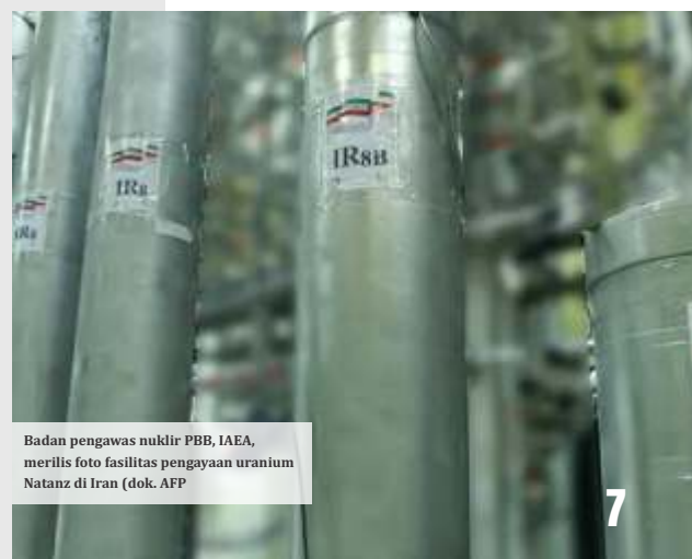
Badan pengawas nuklir PBB, IAEA, merilis foto fasilitas pengayaan uranium Natanz di Iran