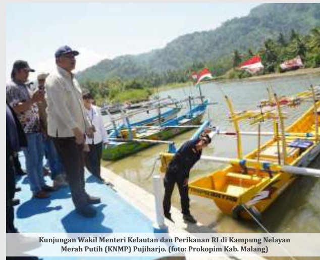
Kunjungan Wakil Menteri Kelautan dan Perikanan RI di Kampung Nelayan Merah Putih (KNMP) Pujiharjo.

Kebutuhan mendesak berikutnya adalah SPBUN. Menurut Victor,