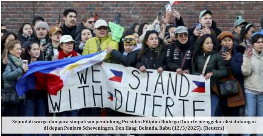
Sejumlah warga dan para simpatisan pendukung Presiden Filipina Rodrigo Duterte menggelar aksi dukungan di depan Penjara Scheveningen, Den Haag, Belanda, Rabu (12/3/2025).

MANILA - Mantan Presiden Filipina Rodrigo Duterte telah tiba di Den Haag, Belanda, berada dalam tahanan Mahkamah Pidana Internasional (ICC).