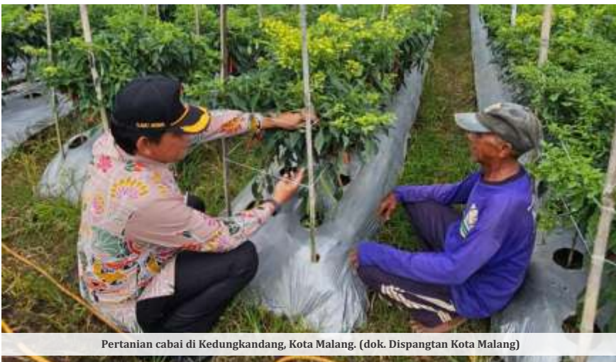
Pertanian cabai di Kedungkandang, Kota Malang.

MALANG - Selisih harga cabai antara tingkat petani dan pasar di Kota Malang jomplang (jauh berbeda Red). Pemerintah Kota (Pemkot) pun menyiapkan langkah untuk menjaga stabilitasnya.