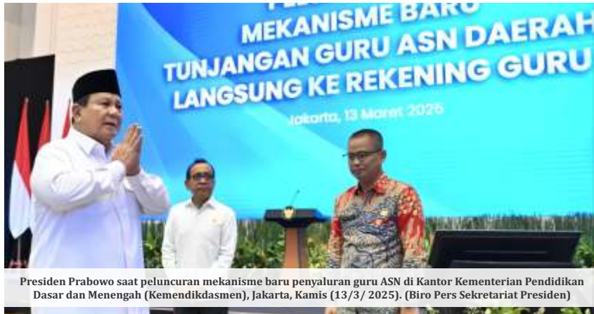
Presiden Prabowo saat peluncuran mekanisme baru penyaluran guru ASN di Kantor Kementerian Pendidikan Dasar dan Menengah (Kemendikdasmen), Jakarta, Kamis (13/3/2025).

"Guru ASN yang menerima transfer langsung adalah 1.476.964, sedangkan untuk guru non-ASN yang berjumlah 392.802 menerima transfer langsung ke rekening masing-masing guru dari Kementerian Pendidikan