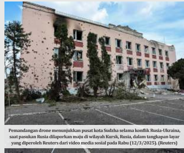
Pemandangan drone menunjukkan pusat kota Sudzha selama konflik Rusia-Ukraina, saat pasukan Rusia dilaporkan maju di wilayah Kursk, Rusia, dalam tangkapan layar yang diperoleh Reuters dari video media sosial pada Rabu (12/3/2025).

Para diplomat dari Inggris, Kanada, Prancis, Jerman, Italia, Jepang, dan Amerika Serikat, ditambah Uni