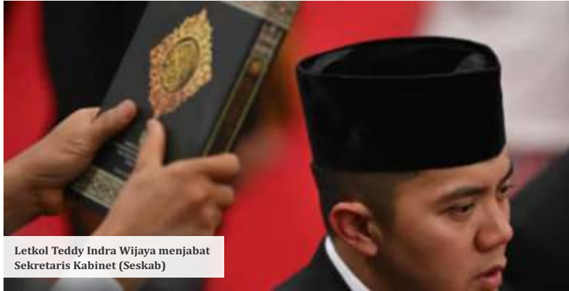
Letkol Teddy Indra Wijaya menjabat Sekretaris Kabinet (Seskab)

Sementara, Menteri Koordinator bidang Politik dan Keamanan (Menko Polkam) Budi Gunawan menilai kenaikan pangkat Sekretaris Kabinet (Seskab) Teddy Indra Wijaya menjadi Letnan Kolonel (Letkol) TNI sudah sesuai prosedur yang berlaku di