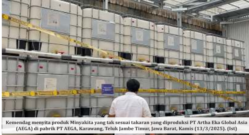
Kemendag menyita produk Minyak Kita yang tak sesuai takaran yang diproduksi PT Artha Eka Global Asia (AEGA) di pabrik PT AEGA, Karawang, Teluk Jambe Timur, Jawa Barat, Kamis (13/3/2025).

"Pengusutan juga harus dilakukan kepada oknum perusahaan produsen yang tidak sama sekali terdaftar akan tetapi melakukan kegiatan produksi yang mengatasnamakan produk Minyak Kita, karena saya juga mendapatkan laporan praktik kecurangan dalam peredaran minyak goreng curah berlabel Minyak Kita palsu," tambahnya.