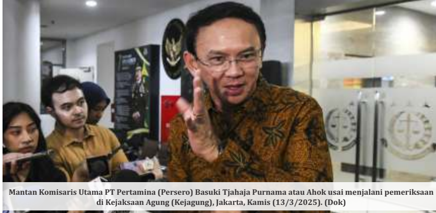
Mantan Komisaris Utama PT Pertamina (Persero) Basuki Tjahaja Purnama atau Ahok usai menjalani pemeriksaan di Kejaksaan Agung (Kejagung), Jakarta, Kamis (13/3/2025).

Ia mengatakan bahwa penyidik tidak menanyakan kepada dirinya mengenai isu 'oplosan' bahan bakar minyak (BBM) RON 92 dengan RON yang lebih rendah sebagaimana yang banyak dibicarakan masyarakat.