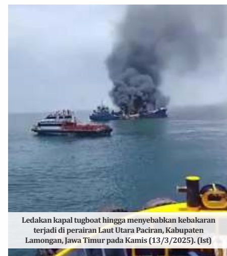
Ledakan kapal tugboat hingga menyebabkan kebakaran terjadi di perairan Laut Utara Paciran, Kabupaten Lamongan, Jawa Timur pada Kamis (13/3/2025). (Ist)

"Kami turut berduka cita atas peristiwa ini. Semoga keluarga korban yang ditinggalkan diberi ketabahan, dan para korban yang selamat maupun yang mengalami luka-luka segera pulih," tambahnya. (ufi, ist, ant/dya)