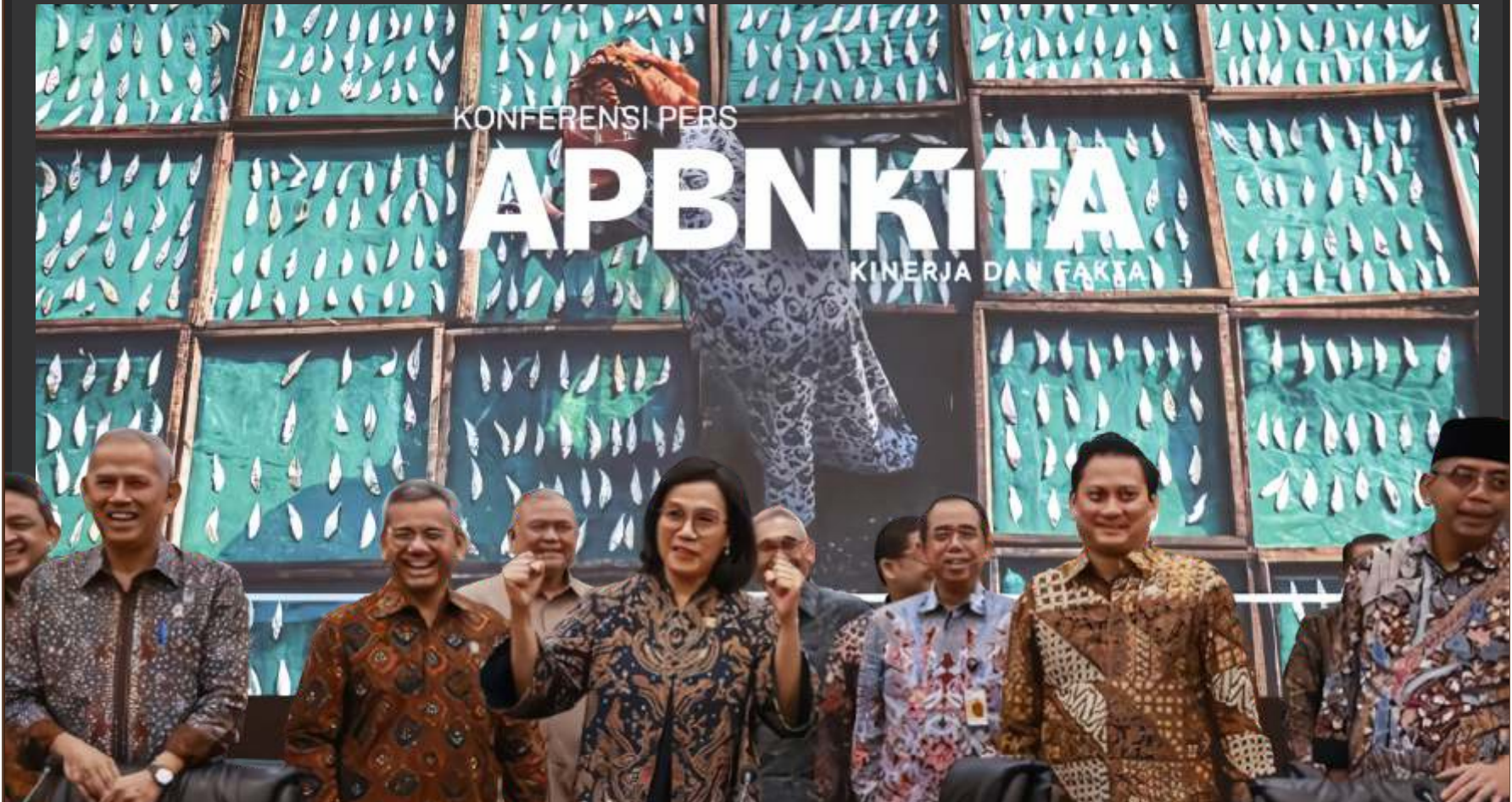
Senyum Menteri Keuangan Sri Mulyani Indrawati dan jajarannya saat konferensi APBN KITA di Kemenkeu, Jakarta pada Kamis (13/3/2025) yang mengungkap fakta APBN Indonesia tekor.