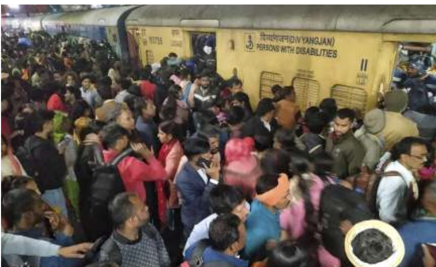
Para penumpang berdesak-desakan untuk menaiki kereta di stasiun kereta api di New Delhi, India, pada Sabtu (15/2/2025).