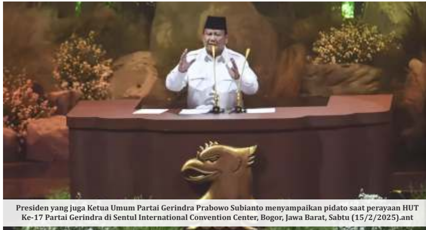
Presiden yang juga Ketua Umum Partai Gerindra Prabowo Subianto menyampaikan pidato saat perayaan HUT Ke-17 Partai Gerindra di Sentul International Convention Center, Bogor, Jawa Barat, Sabtu (15/2/2025).ant

Dalam paparannya, Prabowo menyebut, nilai penghematan anggaran Rp 750 triliun itu setara dengan 44 miliar dollar AS. Ia juga mengatakan, sebagian dana penghematan anggaran itu yakni Rp 24 miliar dollar AS digunakan untuk program makan bergizi gratis (MBG). "24 (miliar dollar AS) terpaksa saya pakai. Untuk apa? Untuk makan bergizi. Rakyat kita, anak-anak kita tidak boleh kelaparan. Kalau ada anak orang kaya yang sudah kenyang, yang sudah makan enak, tidak apa-apa, jatahmu kasih ke orang lain,"