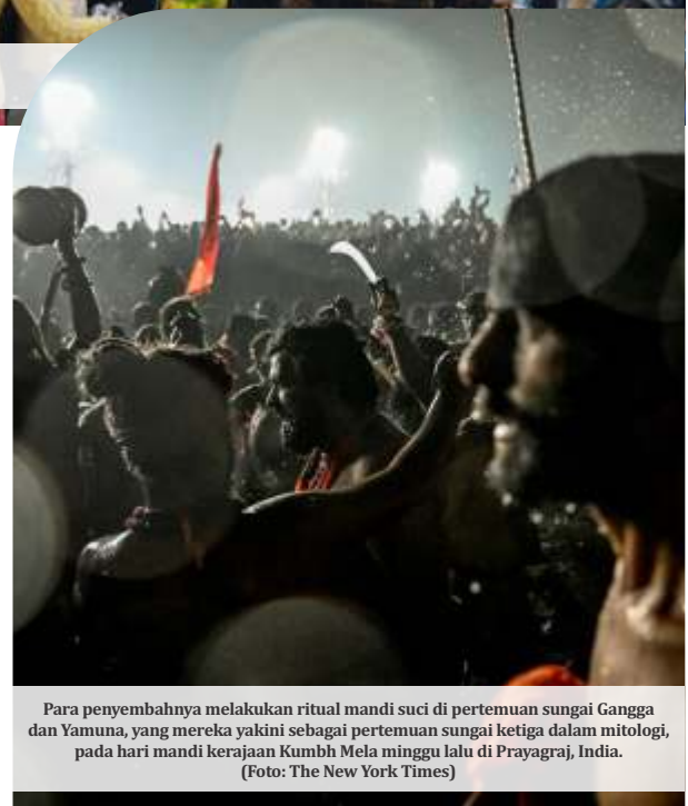
Para penyembahnya melakukan ritual mandi suci di pertemuan sungai Gangga dan Yamuna, yang mereka yakini sebagai pertemuan sungai ketiga dalam mitologi, pada hari mandi kerajaan Kumbh Mela minggu lalu di Prayagraj, India.

Para pejabat mengatakan sekitar 500 juta umat telah mengunjungi festival tersebut sejak dimulai bulan lalu. (AFP, Reuters, Press Trust of India, ist/nei)