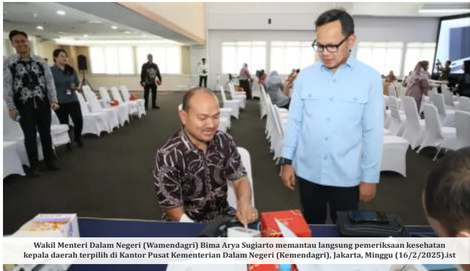
Wakil Menteri Dalam Negeri (Wamendagri) Bima Arya Sugiarto memantau langsung pemeriksaan kesehatan kepala daerah terpilih di Kantor Pusat Kementerian Dalam Negeri (Kemendagri), Jakarta, Minggu (16/2/2025).

Setelah pengecekan kesehatan dasar hari ini, agenda terdekat bagi