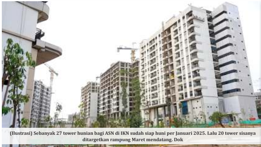
(Ilustrasi) Sebanyak 27 tower hunian bagi ASN di IKN sudah siap huni per Januari 2025. Lalu 20 tower sisanya ditargetkan rampung Maret mendatang. Dok

"Memang kemarin ada misunderstanding. Tapi dengan adanya restrukturisasi anggaran,