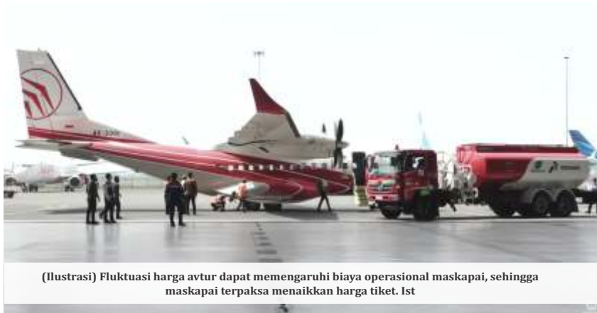
(Ilustrasi) Fluktuasi harga avtur dapat memengaruhi biaya operasional maskapai, sehingga maskapai terpaksa menaikkan harga tiket. Ist

Pernyataan Prabowo soal menurunkan harga itu dia sampaikan ketika berpidato saat perayaan ulang tahun Gerindra. Dia mengatakan ingin