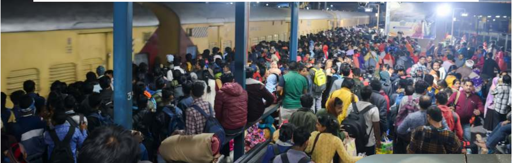
Orang-orang, termasuk peziarah Hindu yang sedang dalam perjalanan untuk menghadiri "Maha Kumbh Mela", atau Festival Kendi Besar, berkumpul di Stasiun Kereta Api New Delhi untuk menaiki kereta di New Delhi, India, Sabtu (15/2/2025).

NEW DELHI - Jumlah korban tewas akibat desak-desakan di stasiun kereta api utama di ibu kota India, New Delhi, meningkat menjadi sedikitnya 18 orang, termasuk lima anak-anak, menurut laporan media pada Minggu (16/2/2025), mengutip kantor berita Press Trust of India.