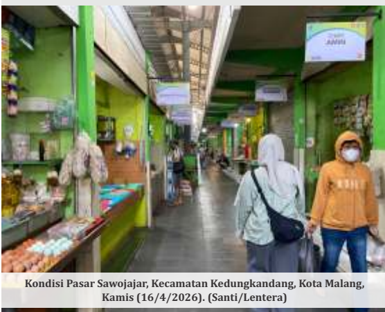
Kondisi Pasar Sawojajar, Kecamatan Kedungkandang, Kota Malang, Kamis (16/4/2026).

MALANG - Pemerintah Kota (Pemkot) Malang mewacanakan pengembangan Pasar Sawojajar menjadi sentra kuliner. Melalui konsep tersebut, pasar tradisional ini ditargetkan mampu menampung puluhan UMKM di Kota Malang.