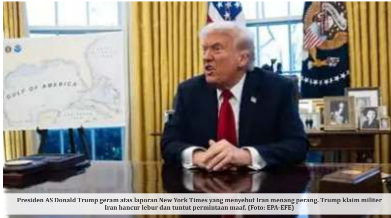
Presiden AS Donald Trump geram atas laporan New York Times yang menyebut Iran menang perang. Trump klaim militer Iran hancur lebur dan tuntutan permintaan maaf.

K etegangan politik di Amerika Serikat kian meningkat setelah Presiden Donald Trump kembali melontarkan ancaman keras terhadap Ketua Federal Reserve