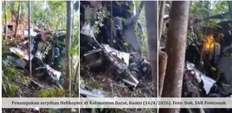
Penampakan serpihan Helikopter di Kalimantan Barat, Kamis (16/4/2026).

pembahasan bersama. Ia memastikan tidak ada rencana penghapusan antrean bagi jemaah yang sudah menunggu lama.