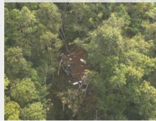
Lokasi serpihan diduga ekor helikopter yang hilang kontak dan jatuh di Sekadau, Kalbar.

Tim SAR sebelumnya telah menemukan indikasi lokasi jatuhnya helikopter melalui pemantauan udara. Serpihan yang diduga bagian ekor helikopter terdeteksi di kawasan hutan Dusun Hulu Peniti setelah dilakukan pencarian intensif dari udara.