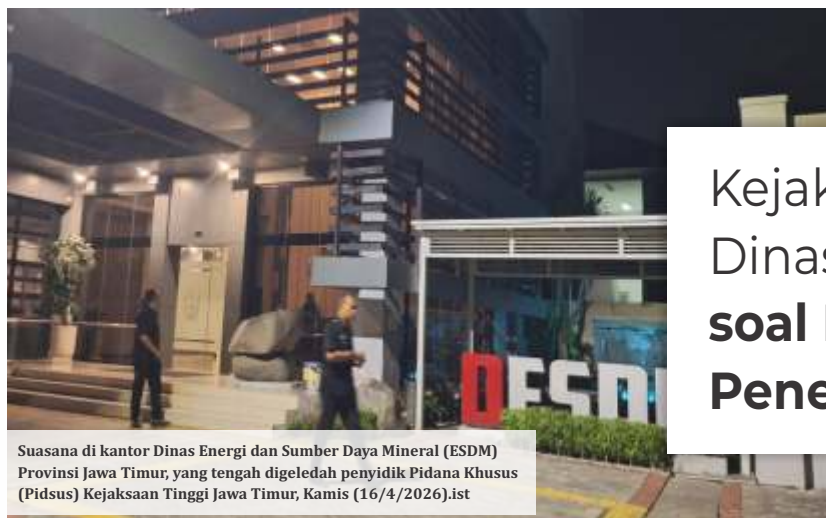
Suasana di kantor Dinas Energi dan Sumber Daya Mineral (ESDM) Provinsi Jawa Timur, yang tengah digeledah penyidik Pidana Khusus (Pidsus) Kejaksaan Tinggi Jawa Timur, Kamis (16/4/2026).