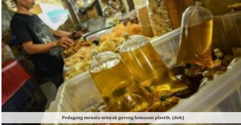
Pedagang menata minyak goreng kemasan plastik.

harga minyak sawit mentah atau crude palm oil (CPO), yang dipicu oleh konflik geopolitik di Asia Barat, turut memberi tekanan terhadap biaya produksi. Namun demikian, kebijakan HET tetap dipertahankan sebagai langkah menjaga stabilitas harga di pasar.