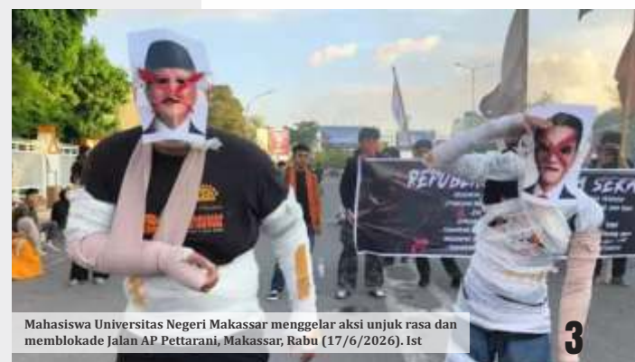
Mahasiswa Universitas Negeri Makassar menggelar aksi unjuk rasa dan memblokir Jalan AP Pettarani, Makassar, Rabu (17/6/2026).