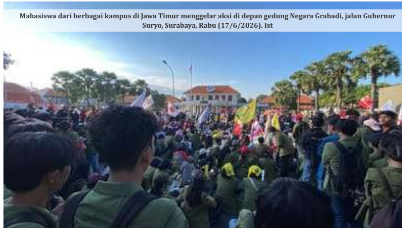
Mahasiswa dari berbagai kampus di Jawa Timur menggelar aksi di depan gedung Negara Grahad, jalan Gubernur Suryo, Surabaya, Rabu (17/6/2026).

Sorotan terhadap BGN menguat setelah tiga mantan petinggi lembaga tersebut ditetapkan sebagai tersangka dugaan korupsi oleh