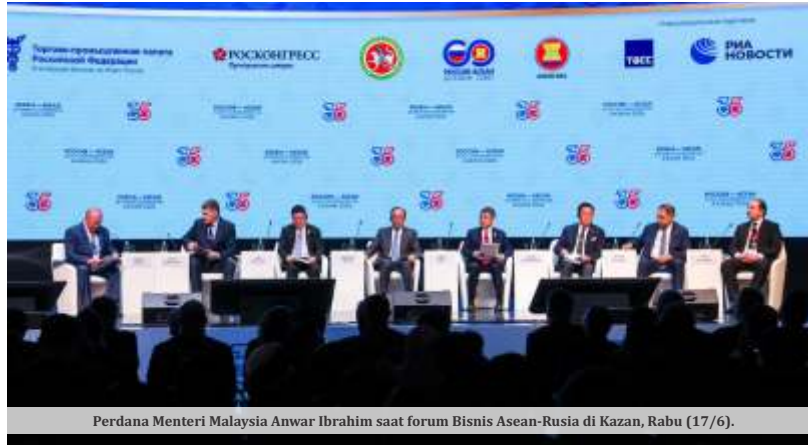
Perdana Menteri Malaysia Anwar Ibrahim saat forum Bisnis Asean-Rusia di Kazan, Rabu (17/6).

Presiden Rusia, Vladimir Putin, mulai Rabu (17/6) menjadi tuan rumah Konferensi Tingkat Tinggi (KTT) Rusia-ASEAN di Kota Kazan. Pertemuan ini berlangsung di tengah meningkatnya tekanan negara-negara Barat yang tergabung dalam Group of Seven agar Rusia segera mengakhiri perang di Ukraina.