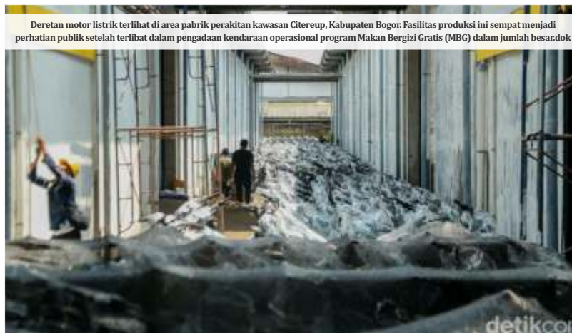
Deretan motor listrik terlihat di area pabrik perakitan kawasan Citeureup, Kabupaten Bogor. Fasilitas produksi ini sempat menjadi perhatian publik setelah terlibat dalam pengadaan kendaraan operasional program Makan Bergizi Gratis (MBG) dalam jumlah besar.

Kejagung mengusut dugaan penyimpangan dalam pengadaan barang untuk Program MBG. Salah satu temuan utama penyidik adalah pengadaan 21.801 unit motor listrik dengan nilai mencapai Rp1,035 triliun.