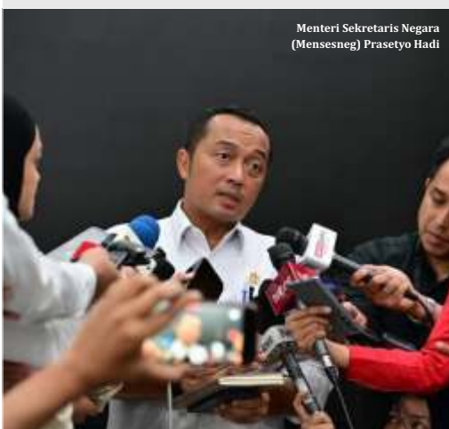
Menteri Sekretaris Negara (Mensesneg) Prasetyo Hadi