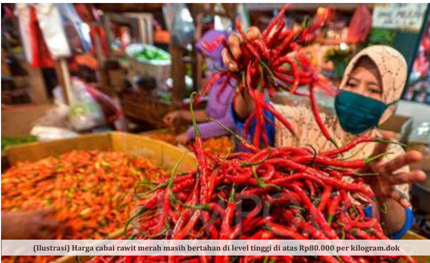
(Ilustrasi) Harga cabai rawit merah masih bertahan di level tinggi di atas Rp80.000 per kilogram.dok