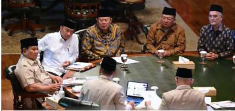
Presiden Prabowo Subianto menerima jajaran Menhaj Irfan Yusuf, Wamenhaj Dahnil Anzar Simanjuntak, serta Tim Pengawas (Timwas) Haji DPR di kediaman pribadinya di Hambalang, Bogor, Rabu (17/6/2026).

Presiden Prabowo Subianto meminta pemerintah terus mencari cara untuk menurunkan biaya penyelenggaraan ibadah haji sekaligus memperpendek masa tunggu keberangkatan jemaah yang masih mencapai puluhan tahun. Permintaan itu disampaikan dalam rapat bersama Menteri Haji dan Umrah, Wakil Menteri Haji, serta Tim Pengawas (Timwas) Haji DPR di Hambalang, Bogor, Rabu (17/6).