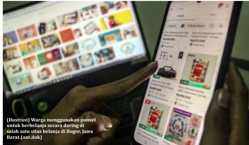
(Ilustrasi) Warga menggunakan ponsel untuk berbelanja secara daring di salah satu situs belanja di Bogor, Jawa Barat.

dalam Peraturan Menteri Keuangan (PMK) Nomor 37 Tahun 2025 yang diundangkan pada 14 Juli 2025. Aturan itu mewajibkan penyelenggara perdagangan melalui sistem