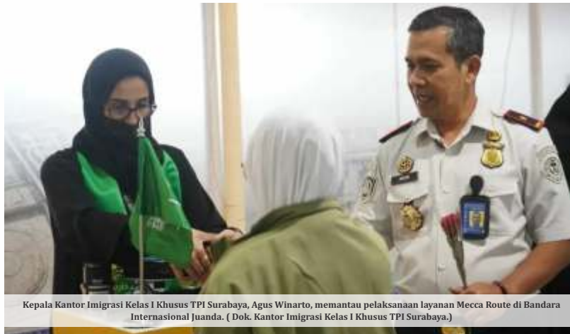
Kepala Kantor Imigrasi Kelas I Khusus TPI Surabaya, Agus Winarto, memantau pelaksanaan layanan Mecca Route di Bandara Internasional Juanda.

Kepala Kantor Imigrasi Kelas I Khusus TPI Surabaya, Agus Winarto, menjelaskan bahwa kegagalan keberangkatan itu dilakukan selama periode 1 hingga 8 Mei 2026. Menurut dia, langkah tersebut merupakan bagian dari komitmen Imigrasi Surabaya dalam menjaga kelancaran pelayanan jemaah haji