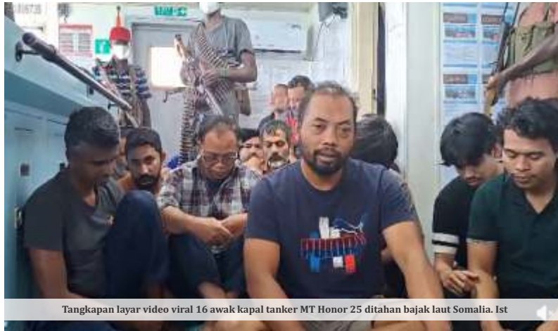
Tangkapan layar video viral 16 awak kapal tanker MT Honor 25 ditahan bajak laut Somalia.

Pencegatan itu disebut terjadi ketika rombongan kapal telah memasuki perairan internasional. Wakil Pemimpin Redaksi Republika, Stevy Maradona, mengungkapkan komunikasi terakhir dengan para jurnalis berlangsung sejak dini hari. Saat itu kru kapal sudah memperingatkan kemungkinan intersepsi oleh angkatan laut Israel