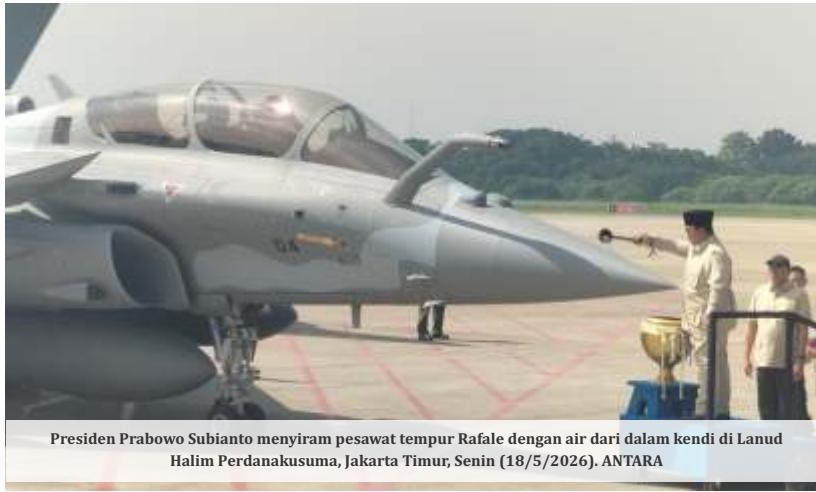
Presiden Prabowo Subianto menyiram pesawat tempur Rafale dengan air dari dalam kendi di Lanud Halim Perdanakusuma, Jakarta Timur, Senin (18/5/2026).

D alam acara tersebut, Indonesia resmi menerima enam unit jet tempur multirole Rafale produksi Dassault Aviation, empat pesawat Falcon 8X, satu pesawat Airbus A400M Atlas Multi Role Tanker Transport (MRTT), radar Ground Control Intervention (GCI) GM403, sistem persenjataan Smart Weapon Hammer, serta rudal udara-ke-udara Meteor. Penyerahan ini disebut pemerintah sebagai salah satu tonggak penting penguatan postur pertahanan Indonesia.