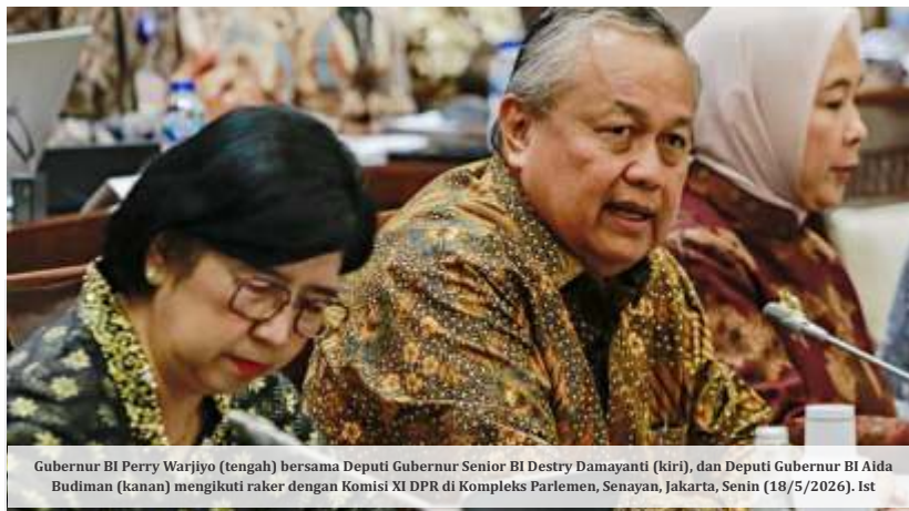
Gubernur BI Perry Warjiyo (tengah) bersama Deputi Gubernur Senior BI Destry Damayanti (kiri), dan Deputi Gubernur BI Aida Budiman (kanan) mengikuti raker dengan Komisi XI DPR di Kompleks Parlemen, Senayan, Jakarta, Senin (18/5/2026).

Di tengah kepanikan pasar, pernyataan Presiden Prabowo Subianto justru memunculkan kontroversi. Dalam beberapa kesempatan, Prabowo menyebut masyarakat desa tidak menggunakan dolar AS sehingga pelemahan rupiah tidak perlu terlalu dikhawatirkan. Pernyataan itu memicu kritik karena pelemahan kurs terhadap harga pangan, energi, hingga biaya impor industri nasional. (wid,ist,kum/dya)