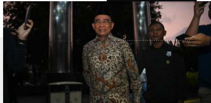
Penasihat Khusus Presiden Bidang Haji Muhadjir Effendy berjalan menuju ruang pemeriksaan setibanya di Gedung Merah Putih KPK, Jakarta, Senin (18/5/2026)

Muhadjir diperiksa dalam kapasitasnya sebagai Menteri Agama ad interim pada 2022 ketika Menteri Agama saat itu, Yaqut Cholil Qoumas, sedang berada di Arab Saudi. Ia