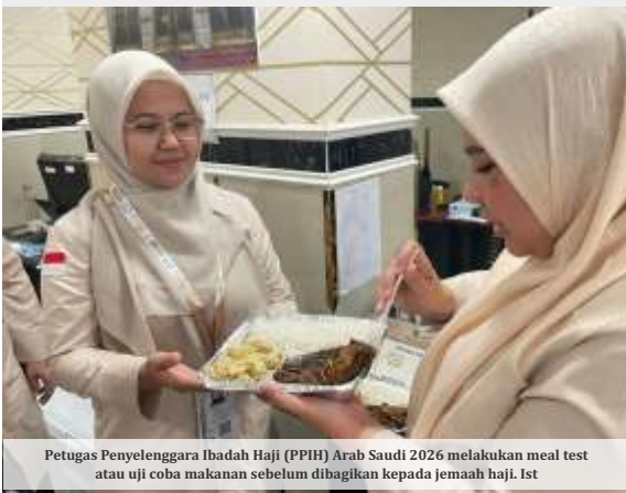
Petugas Penyelenggara Ibadah Haji (PPIH) Arab Saudi 2026 melakukan meal test atau uji coba makanan sebelum dibagikan kepada jemaah haji.

MENJELANG puncak ibadah haji 1447 Hijriah atau Haji 2026, pemerintah memperkuat kesiapan layanan bagi jemaah Indonesia di Arab Saudi. Salah satu langkah utama yang disiapkan ialah penerapan skema makanan siap santap atau ready to eat guna mengantisipasi kepadatan ekstrem saat fase Arafah, Muzdalifah, dan Mina (Armuzna).