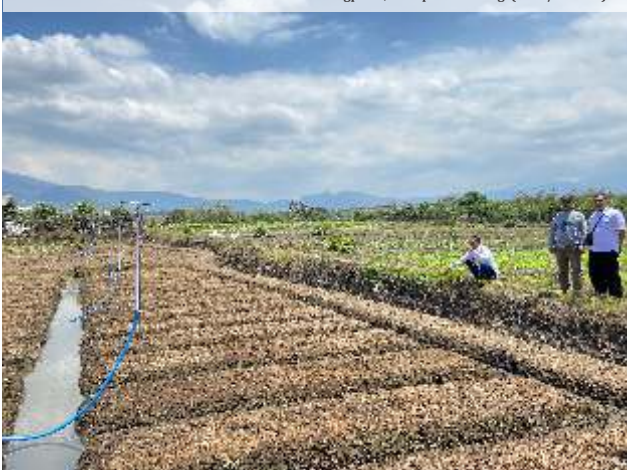
Ilustrasi: Lahan sawah di kawasan Kecamatan Karangploso, Kabupaten Malang.

MALANG - DPRD Kabupaten Malang mengungkap puluhan hektare lahan sawah produktif yang masuk kategori Lahan Sawah Dilindungi (LSD), diduga beralih fungsi menjadi perumahan dan kawasan industri.