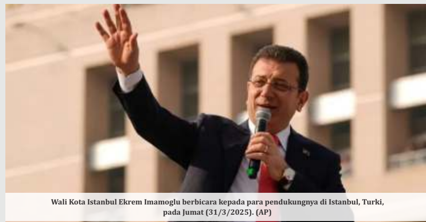
Wali Kota Istanbul Ekrem Imamoglu berbicara kepada para pendukungnya di Istanbul, Turki, pada Jumat (31/3/2025).

Namun laporan media lokal, termasuk dari kantor berita Turki, Anadolu, mengatakan penahanannya juga terkait dengan penyelidikan terpisah atas dugaan