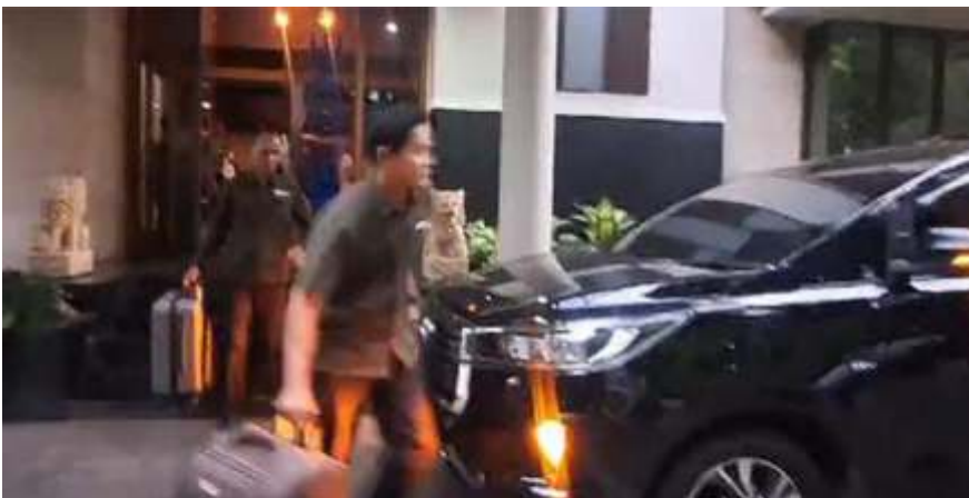
Penyidik KPK membawa 2 koper dari kantor Visi Law Office usai penggeledahan pada Rabu (19/3/2025) di jalan Metro Kencana Pondok Indah, Kebayoran Lama.

JAKARTA- Komisi Pemberantasan Korupsi (KPK) menggeledah kantor pengacara Visi Law Office di kawasan Pondok Indah, Jakarta Selatan, pada Rabu (19/3/2025). Penggeledahan ini terkait perkara dugaan pencucian uang yang menjerat mantan Mentan Syahrul Yasin Limpo (SYL).