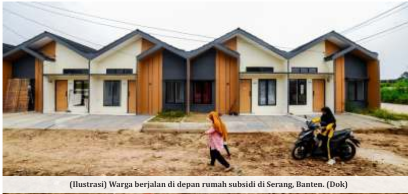
(Ilustrasi) Warga berjalan di depan rumah subsidi di Serang, Banten.