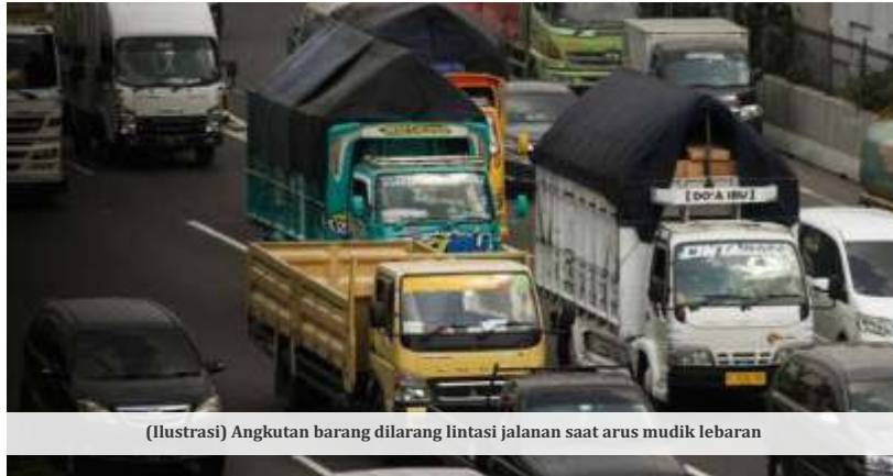
(Ilustrasi) Angkutan barang dilarang lintasi jalanan saat arus mudik lebaran

Dalam beleid itu diputuskan untuk melakukan pembatasan operasional angkutan barang dengan kategori