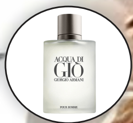
Si Tenang dan Natural Aroma Green atau Aquatic yang Fresh