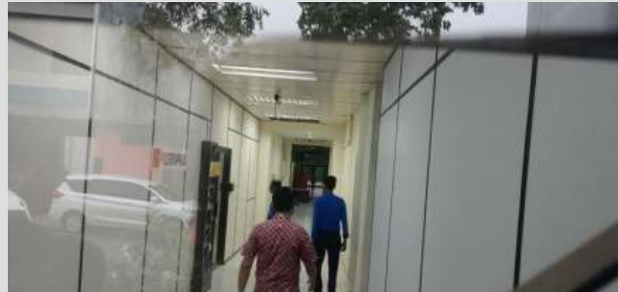
Ruangan Kantor Perencanaan Proyek Strategis BP Batam Sedang dilakukan pemeriksaan oleh petugas Tipikor dan Siber Ditreskrimsus Polda Kepri, Rabu (19/03/2025). (Ist)

"Meskipun proses penyidikan telah berjalan intensif dan penggeledahan telah dilakukan di beberapa