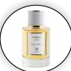
Si Manis dan Romantis Aroma Vanilla atau Floral yang Lembut