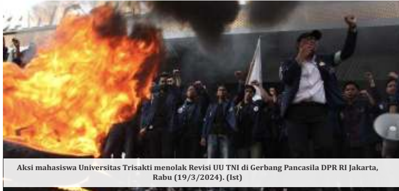
Aksi mahasiswa Universitas Trisakti menolak Revisi UU TNI di Gerbang Pancasila DPR RI Jakarta, Rabu (19/3/2024).

"Karena sekarang bukan hanya PNS saja yang sipil sekarang pensiunnya sudah 60 tahun nah karena itu tidak adil kalau kemudian bagi perwira terutama perwira tinggi yang kita cetak dengan begitu luar biasa kemudian mereka harus pensiun