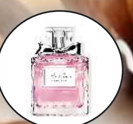
Si Ramah dan Rendah Hati Aroma Floral