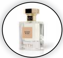
Si Elegan dan Berkelas Aroma Woody atau Musky yang Mewah

Setiap parfum memiliki aroma yang unik dan hasilnya bisa berbeda pada setiap individu. Hal ini karena adanya interaksi antara parfum dengan pH kulit dan unsur kimia yang ada pada tubuh. Oleh karena itu, cobalah beberapa sampel parfum sebelum memutuskan untuk membeli parfum dalam ukuran besar. Menggunakan sampel parfum memberi kesempatan untuk menguji aroma parfum dan melihat bagaimana aroma itu bereaksi. Pasalnya beberapa parfum punya tingkatan wangi berbeda yang bisa berubah setelah beberapa jam. (nei,ist/dya)