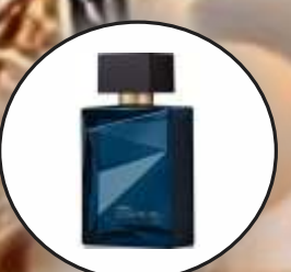
Si Mandiri dan Percaya Diri Aroma Oriental yang Berani