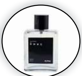
Si Ceria dan Aktif Aroma Citrus yang Segar