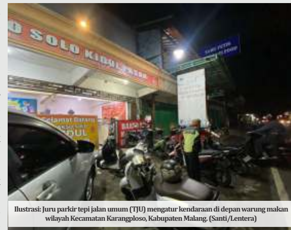
Ilustrasi: Juru parkir tepi jalan umum (TJU) mengatur kendaraan di depan warung makan wilayah Kecamatan Karangploso, Kabupaten Malang.

harus sesuai dengan identitas jukir yang bersangkutan. "Yang penting nominal setoran sesuai dengan tagihan yang tertera di sistem," imbuhnya.