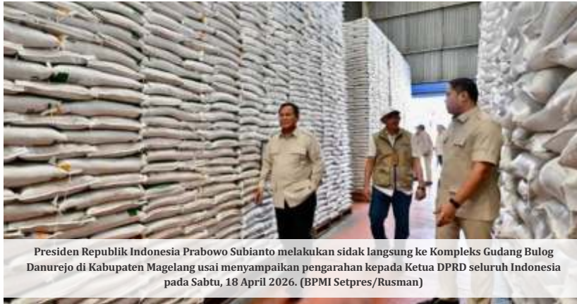
Presiden Republik Indonesia Prabowo Subianto melakukan sidak langsung ke Kompleks Gudang Bulog Danurejo di Kabupaten Magelang usai menyampaikan pengarahan kepada Ketua DPRD seluruh Indonesia pada Sabtu, 18 April 2026.

Dalam kunjungan itu, rombongan meninjau gudang Bulog berkapasitas 7.000 ton yang saat ini terisi penuh. Kondisi tersebut disebut menjadi