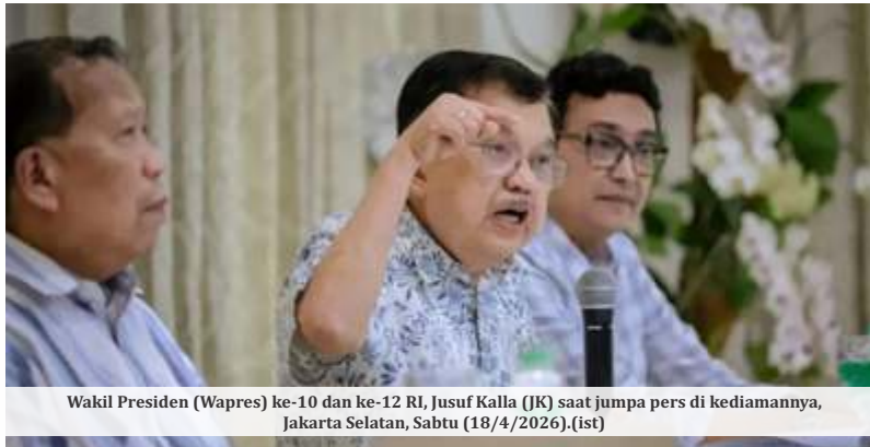
Wakil Presiden (Wapres) ke-10 dan ke-12 RI, Jusuf Kalla (JK) saat jumpa pers di kediamannya, Jakarta Selatan, Sabtu (18/4/2026).

Kalla juga menyinggung sejumlah pihak yang mencoba menghubunginya, termasuk Roy Suryo. Namun, ia menolak karena ingin tetap berada di posisi netral.