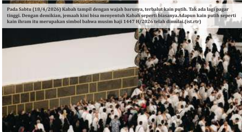
Pada Sabtu (18/4/2026) Kabah tampil dengan wajah barunya, terbalut kain putih. Tak ada lagi pagar tinggi. Dengan demikian, jemaah kini bisa menyentuh Kabah seperti biasanya. Adapun kain putih seperti kain ihram itu merupakan simbol bahwa musim haji 1447 H/2026 telah dimulai.

"Infrastruktur di sisi udara seperti runway, taxiway, dan apron dipastikan siap mendukung operasional pesawat berbadan lebar atau wide body seperti Boeing 777 dan Airbus A330 untuk penerbangan haji," kata Pahlevi.