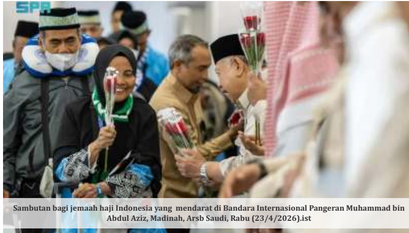
Sambutan bagi jemaah haji Indonesia yang mendarat di Bandara Internasional Pangeran Muhammad bin Abdul Aziz, Madinah, Arab Saudi, Rabu (23/4/2026).ist

S eorang calon jemaah haji asal Kabupaten Soppeng, Sulawesi Selatan, dipastikan batal berangkat bersama kloter pertama Embarkasi Makassar setelah hasil