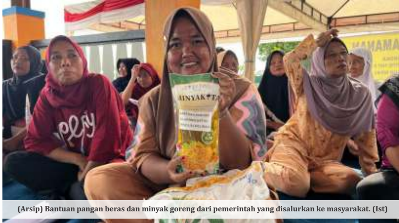
(Arsip) Bantuan pangan beras dan minyak goreng dari pemerintah yang disalurkan ke masyarakat. (Ist)

M enteri Koordinator Bidang Pangan Zulkifli Hasan menyebut penggunaan Minyakita dalam program bantuan selama ini turut menekan pasokan di pasar.