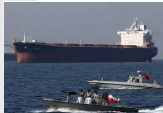
kapal-kapal dari Angkatan Laut Korps Garda Revolusi Iran (IRGC) sedang beroperasi di Selat Hormuz.

Meski demikian, Sugiono memastikan kondisi pasokan energi nasional masih aman. Ia menekankan bahwa ketergantungan Indonesia terhadap pasokan dari kawasan Timur Tengah tidak dominan, karena sumber impor tersebar dari berbagai negara. (tin,ist,rtr/dya)