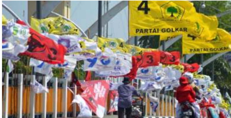
Kendaraan melintas di dekat bendera Partai Politik yang terpasang pada pembatas jalan di Jakarta.(dokant)

S ekretaris Jenderal Partai Kebangkitan Bangsa (PKB), Hasanuddin Wahid, mendorong agar revisi Undang-Undang Pemilu segera dibahas pada tahun ini. Ia menyebut berbagai proses