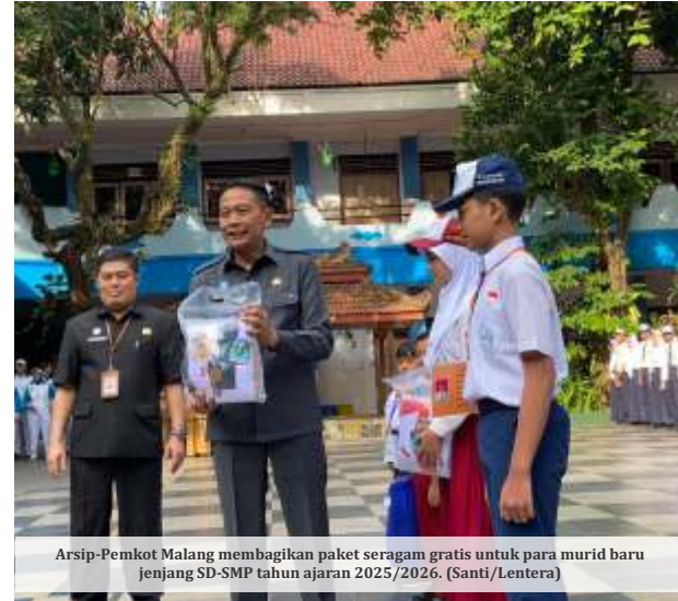
Arsip-Pemkot Malang membagikan paket seragam gratis untuk para murid baru jenjang SD-SMP tahun ajaran 2025/2026.

Untuk siswa SD, bantuan berupa satu stel seragam merah putih dan satu stel seragam pramuka. Sementara untuk siswa SMP, bantuan berupa