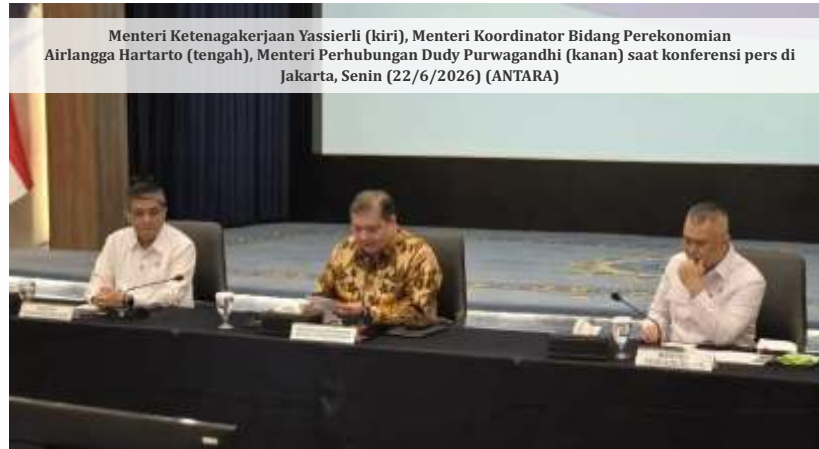
Menteri Ketenagakerjaan Yassierli (kiri), Menteri Koordinator Bidang Perekonomian Airlangga Hartarto (tengah), Menteri Perhubungan Dudy Purwagandhi (kanan) saat konferensi pers di Jakarta, Senin (22/6/2026)

Pemerintah resmi mengambil langkah taktis untuk membentengi perekonomian domestik dari rambatan ketidakpastian global di paruh kedua tahun ini. Melalui konferensi pers di Jakarta pada Senin (22/6) sore, Menteri Koordinator Bidang Perekonomian Airlangga Hartarto mengumumkan peluncuran paket stimulus ekonomi jumbo senilai Rp26,34 triliun yang dijadwalkan cair pada semester II-2026.