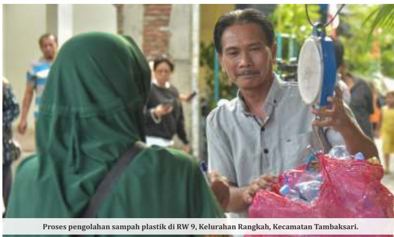
Proses pengolahan sampah plastik di RW 9, Kelurahan Rangkah, Kecamatan Tambaksari.

Persoalan minimnya sarana pendukung tersebut juga menjadi salah satu temuan dalam kegiatan reses yang dilakukan Bahtiyar di sejumlah wilayah Surabaya. Salah satunya disampaikan warga RW 1 Kelurahan Simo Mulyo yang mengaku telah mendapatkan sosialisasi mengenai pemilahan sampah, tetapi belum memperoleh fasilitas penunjang.