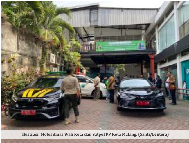
Ilustrasi: Mobil dinas Wali Kota dan Satpol PP Kota Malang.