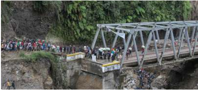
Antrean warga menyeberang sungai dengan jembatan darurat di wilayah Tenge Besi, Kecamatan Pintu Rime Gayo, Kabupaten Bener Meriah, Aceh, Sabtu (20/12/2025).dok

Ketua Komisi IX DPR RI merespons keputusan Badan Gizi Nasional (BGN) yang tetap menjalankan program Makan Bergizi Gratis (MBG) di masa libur sekolah.