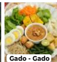
Gado - Gado