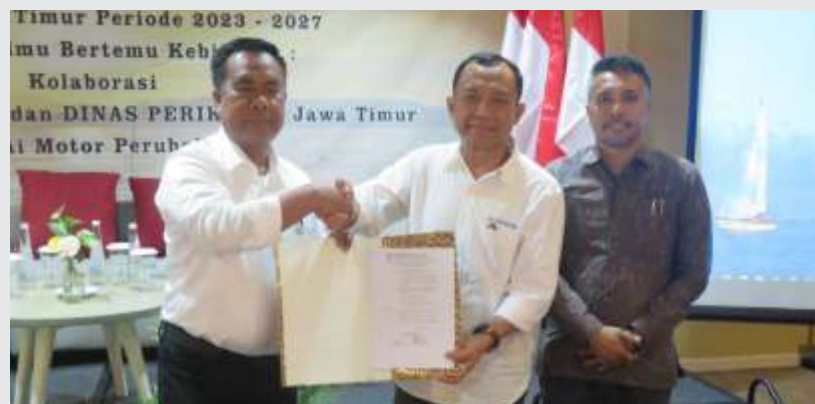
DBHCHT Kab Pasuruan 2025 untuk perbaikan jalan dan jembatan.

"ISPIKANI harus hadir tidak hanya sebagai komunitas akademik, tetapi juga sebagai mitra strategis pemerintah daerah dalam