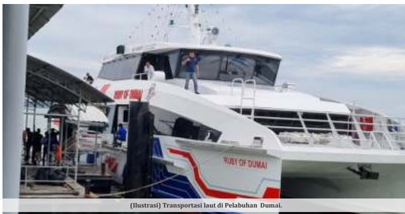
(Ilustrasi) Transportasi laut di Pelabuhan Dumai.

hadiran jembatan ini akan membawa dampak ekonomi yang signifikan apabila benar-benar terealisasi. Ab Rauf menyatakan optimisme terhadap potensi proyek tersebut. "Kami yakin, jika direalisasikan, jembatan ini akan memberikan dampak ekonomi yang signifikan bagi Melaka," katanya.