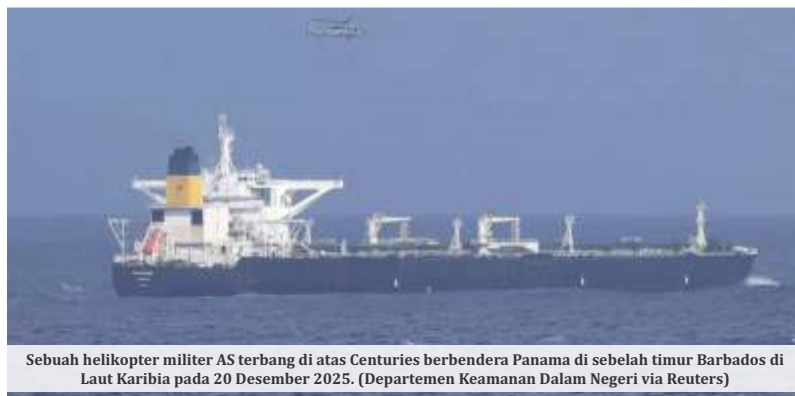
Sebuah helikopter militer AS terbang di atas Centuries berbendera Panama di sebelah timur Barbados di Laut Karibia pada 20 Desember 2025.

Pernyataan China itu disampaikan ketika pasukan AS memburu kapal tanker minyak Venezuela lainnya di