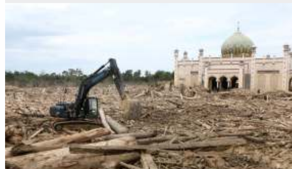
Petugas mengoperasikan alat berat untuk membersihkan gelondongan kayu di pesantren Islam Terpadu Darul Mukhlisin, Desa Tanjung Karang, Aceh Tamiang, Aceh, Minggu (21/12/2025).