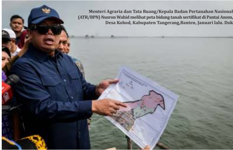
Menteri Agraria dan Tata Ruang/Kepala Badan Pertanahan Nasional (ATR/BPN) Nusron Wahid melihat peta bidang tanah sertifikat di Pantai Anom, Desa Kohod, Kabupaten Tangerang, Banten, Januari lalu. Dok

Ke depannya, Nusron berkomitmen untuk terus mengawal jalannya penyelesaian masalah pagar