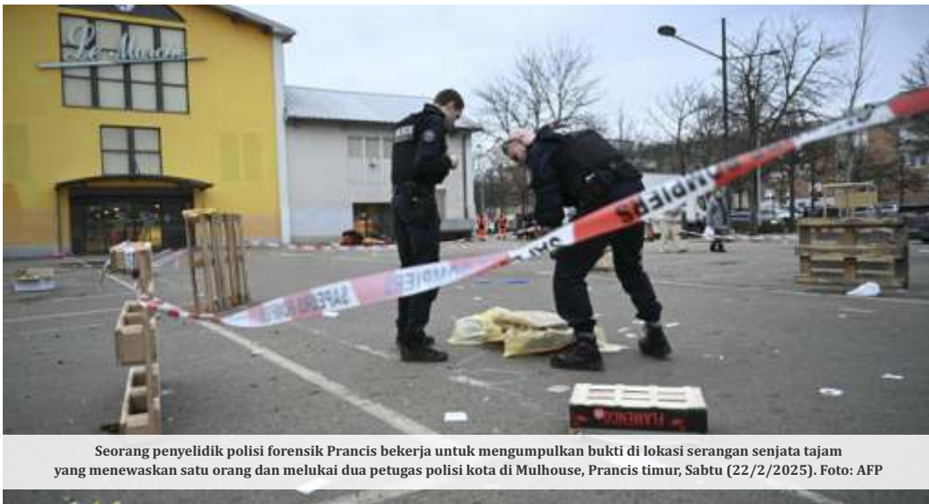
Seorang penyelidik polisi forensik Prancis bekerja untuk mengumpulkan bukti di lokasi serangan senjata tajam yang menewaskan satu orang dan melukai dua petugas polisi kota di Mulhouse, Prancis timur, Sabtu (22/2/2025).

MULHOUSE – Serangan pisau yang mengguncang Kota Mulhouse terjadi pada Sabtu (22/2/2025) sore, menewaskan satu orang dan melukai tiga polisi.