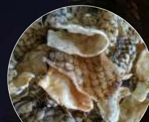
Krupuk Ikan Kenjeran