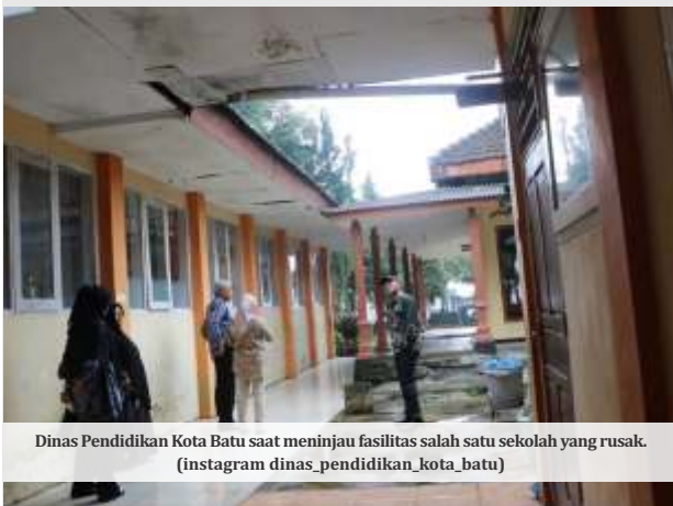
Dinas Pendidikan Kota Batu saat meninjau fasilitas salah satu sekolah yang rusak.