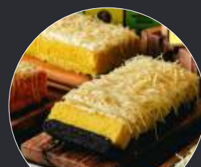
Lapis Kukus Surabaya

membuat Lapis Kukus Surabaya kerap jadi incaran sebagai oleh-oleh khas Surabaya. (nei,ist/dya)