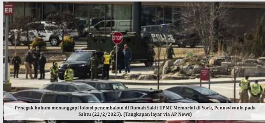
Penegak hukum menanggapi lokasi penembakan di Rumah Sakit UPMC Memorial di York, Pennsylvania pada Sabtu (22/2/2025).

dan ingin berhasil dalam semua yang saya lakukan," kata profil LinkedIn milik Duarte.