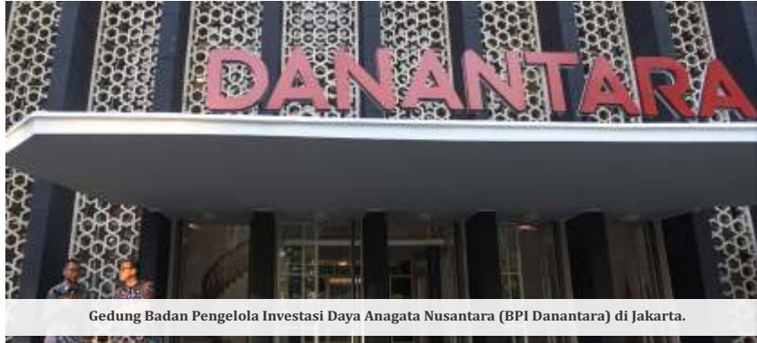
Gedung Badan Pengelola Investasi Daya Anagata Nusantara (BPI Danantara) di Jakarta.

JAKARTA — Presiden ke-8 RI Prabowo Subianto merilis Badan Pengelola Investasi (BPI) Danantara Senin (24/2/2025). Kepala negara dikabarkan sudah menunjuk para pengurus lembaga investasi tersebut.