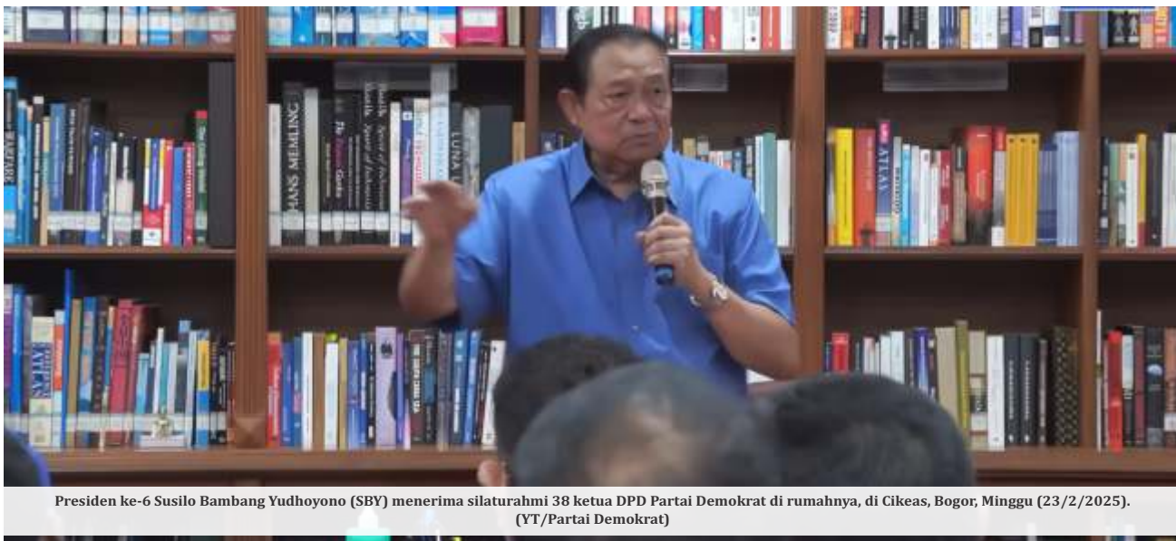
Presiden ke-6 Susilo Bambang Yudhoyono (SBY) menerima silaturahmi 38 ketua DPD Partai Demokrat di rumahnya, di Cikeas, Bogor, Minggu (23/2/2025).

BOGOR-Ketua Majelis Tinggi Partai Demokrat Susilo Bambang Yudhoyono (SBY) berkumpul bersama 38 Ketua DPD partai di kediamannya, di Cikeas, Bogor, Jawa Barat, Minggu (23/2/2025). Selain mengajak nostalgia pembentukan partai, SBY juga memberi pesan kepada para ketua DPD.