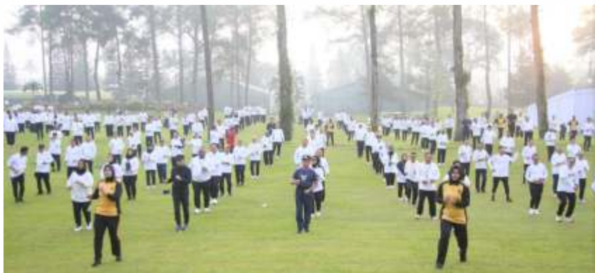
Mendagri, Muhammad Tito Karnavian dan Wamendagri, Bima Arya Sugiarto ikut bergabung dengan ara peserta retreat kepala daerah saat senam pagi di Magelang, Sabtu (22/2/2025).

Sebagai informasi, peserta retreat kepala daerah di hari ketiga berjumlah 450 orang. Retreat ini akan digelar selama delapan hari, terhitung 21-28