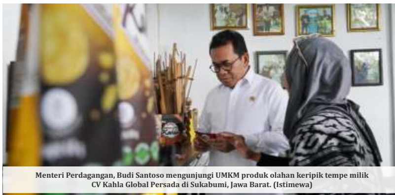
Menteri Perdagangan, Budi Santoso mengunjungi UMKM produk olahan keripik tempe milik CV Kahla Global Persada di Sukabumi, Jawa Barat.

Sementara itu, Badan Pangan Nasional (Bapanas) memberikan sinyal harga Minyakita dapat mengalami penurunan sebelum Ramadan. Saat ini, Minyakita masih dijual di atas harga eceran tertinggi (HET) Minyakita sebesar Rp