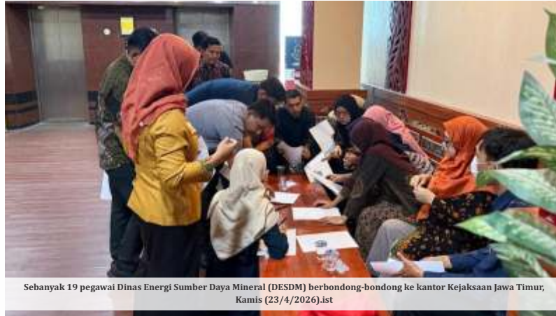
Sebanyak 19 pegawai Dinas Energi Sumber Daya Mineral (DESDM) berbondong-bondong ke kantor Kejaksanaan Jawa Timur, Kamis (23/4/2026).ist

Selain itu, penyidik menemukan catatan pembagian keuangan dengan tulisan petunjuk pimpinan yang tidak sah di ruang Kepala Dinas dan Kabid