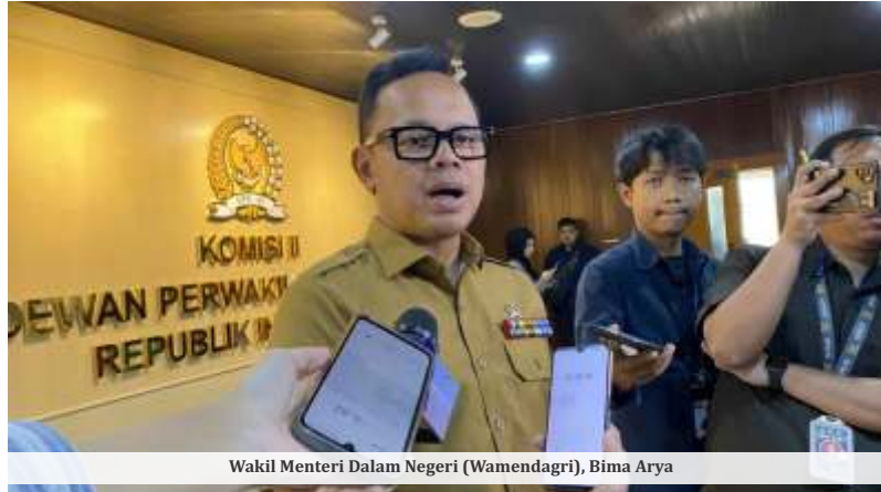
Wakil Menteri Dalam Negeri (Wamendagri), Bima Arya

A nggota Komisi II DPR dari Fraksi PKB, Ali Ahmad, mengatakan KTP bukan sekadar kartu identitas administratif, melainkan akses utama warga terhadap hak-hak dasar. "KTP adalah pintu masuk bagi warga negara untuk