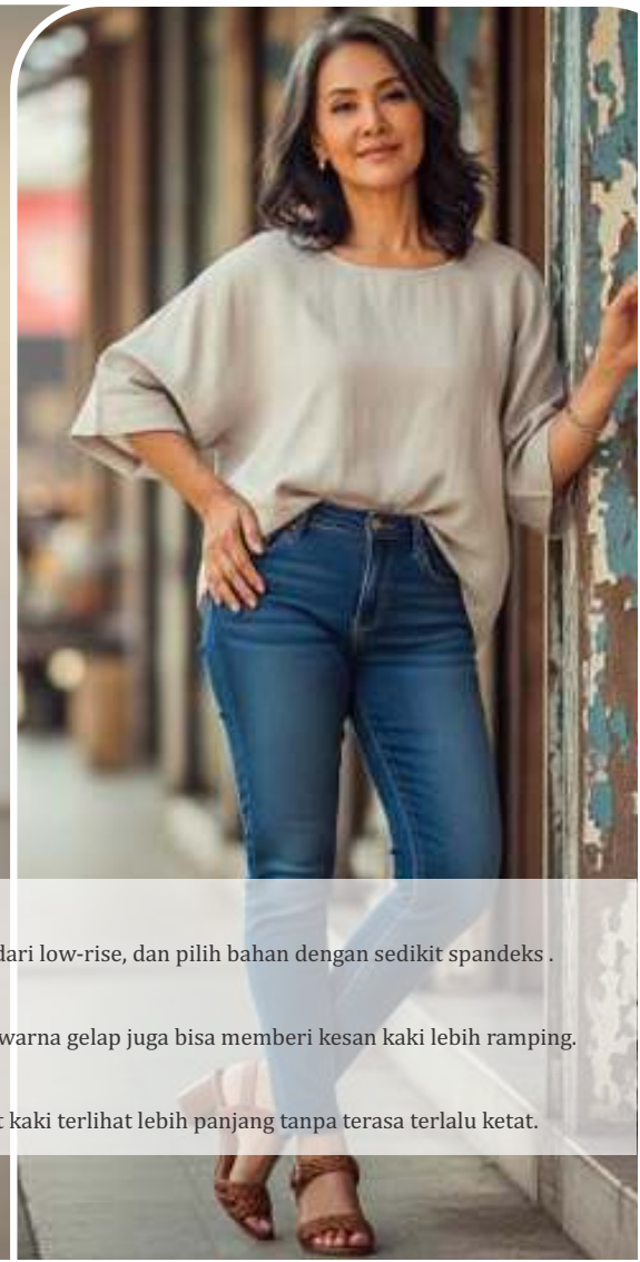
Bentuk Tubuh Lansia dan Pilihan Jeans yang Tepat