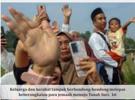
Keluarga dan kerabat tampak berbondong-bondong melepas keberangkatan para jamaah menuju Tanah Suci.