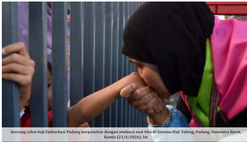
Seorang calon haji Embarkasi Padang berpamitan dengan anaknya saat tiba di Asrama Haji Tabing, Padang, Sumatera Barat, Kamis (23/4/2026).

payung, kacamata, masker, serta alas kaki yang nyaman. Selain itu penting untuk rutin minum air, sekitar dua hingga tiga teguk setiap 20-30 menit," katanya.