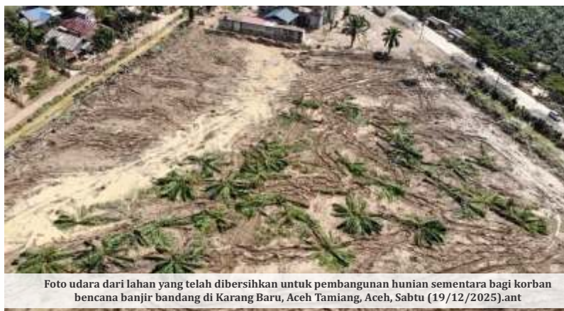
Foto udara dari lahan yang telah dibersihkan untuk pembangunan hunian sementara bagi korban bencana banjir bandang di Karang Baru, Aceh Tamiang, Aceh, Sabtu (19/12/2025).ant

"Jadi ketika bulan-bulan terakhir ini, curah hujan cukup tinggi yang membuat kondisi tanah itu atau lereng-lereng itu dalam kondisi yang cukup jenuh, sehingga dengan hujan yang mungkin tidak begitu besar itu dapat memicu terjadinya bencana gerakan tanah, longsor, dan juga banjir atau