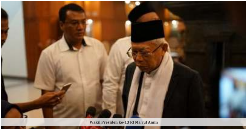
Wakil Presiden ke-13 RI Ma'ruf Amin

"Melalui surat ini, saya juga ingin menyampaikan permohonan maaf jika selama menjabat sebagai Ketua