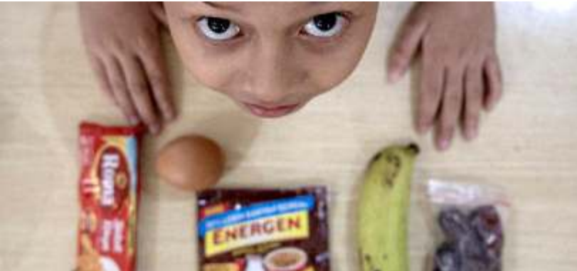
Siswa menunjukkan paket keringan Program Makan Bergizi Gratis (MBG) di SD Negeri 25 Palembang, Sumatera Selatan.

Nanik mengklaim, dari total anggaran MBG tahun 2025 sebesar Rp 71 triliun yang semula ditargetkan untuk menjangkau 6 juta penerima manfaat, pemerintah justru mampu memperluas cakupan hingga 50 juta anak sekolah serta kelompok ibu hamil, ibu menyusui, dan balita atau kelompok 3B. Menurut Nanik, penghematan anggaran terjadi karena banyak dapur MBG dibangun oleh mitra dan yayasan secara mandiri, sehingga BGN tidak perlu mengeluarkan biaya pembangunan dapur.