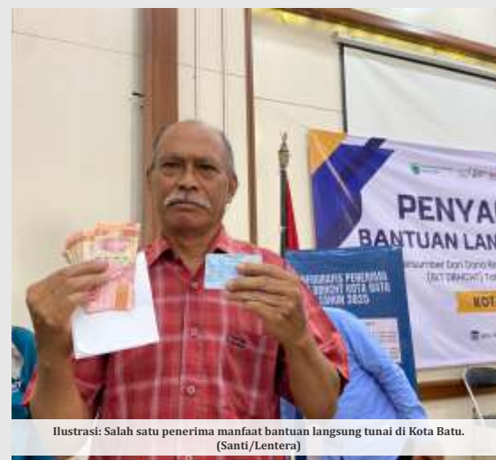
Ilustrasi: Salah satu penerima manfaat bantuan langsung tunai di Kota Batu.

Pemerintah pusat sendiri menargetkan sebanyak 300 ribu keluarga penerima manfaat dapat graduasi dari Program Keluarga Harapan pada tahun 2026,