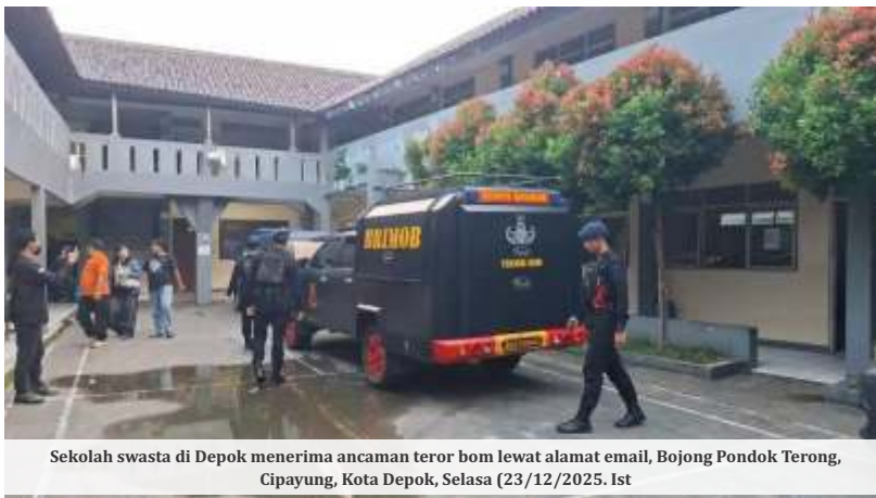
Sekolah swasta di Depok menerima ancaman teror bom lewat alamat email, Bojong Pondok Terong, Cipayung, Kota Depok, Selasa (23/12/2025). Ist

Ancaman teror bom menggegerkan dunia pendidikan di Kota Depok. Sebanyak 10 sekolah tingkat SMA sederajat dilaporkan menerima email berisi ancaman bom pada Selasa (23/12/2025) dini hari. Menindaklanjuti informasi tersebut, Polres Metro Depok langsung menerjunkan tim ke sejumlah lokasi untuk melakukan pengecekan dan penyelidikan. Hingga berita ini diturunkan, polisi mengatakan tidak ditemukan benda mencurigakan.