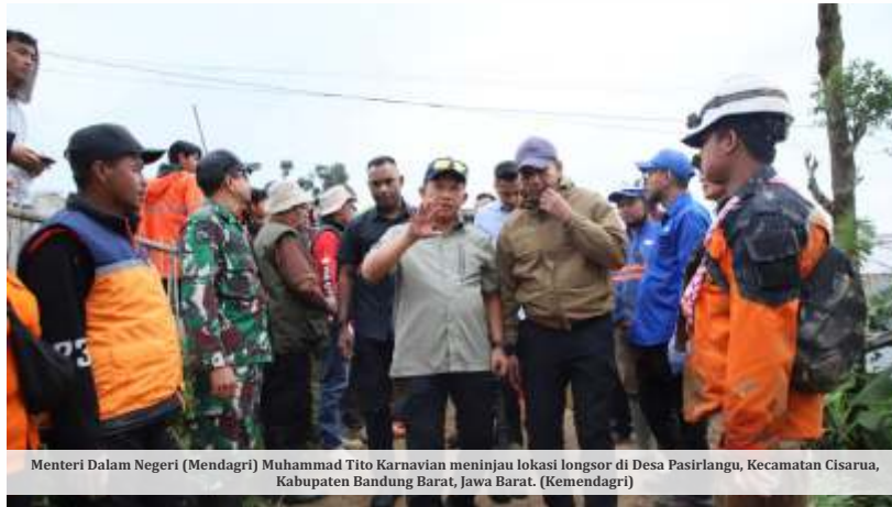
Menteri Dalam Negeri (Mendagri) Muhammad Tito Karnavian meninjau lokasi longsor di Desa Pasirlangu, Kecamatan Cisarua, Kabupaten Bandung Barat, Jawa Barat.

Menurut Tito, karakter tanah di kawasan perbukitan Cisarua tergolong gembur dan berpasir, sehingga sangat rawan longsor, terlebih saat curah hujan tinggi. Ia menyebut, kondisi tersebut memiliki kemiripan dengan sejumlah bencana longsor di daerah lain di Indonesia.