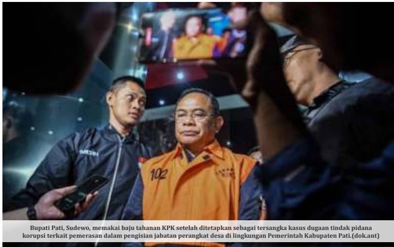
Bupati Pati, Sudewo, memakai baju tahanan KPK setelah ditetapkan sebagai tersangka kasus dugaan tindak pidana korupsi terkait pemerasan dalam pengisian jabatan perangkat desa di lingkungan Pemerintah Kabupaten Pati.

Indonesia Corruption Watch (ICW) menilai maraknya kasus korupsi di tingkat daerah tidak bisa dilepaskan dari buruknya kualitas tata kelola partai politik sebagai