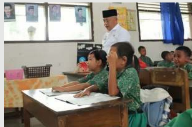
Bupati Malang, Sanusi meninjau kegiatan belajar mengajar di SDN 3 Toyomarto, Kecamatan Singosari beberapa waktu lalu.

"Kira-kira bagaimana permasalahan jarak tempuh itu solusinya seperti apa. Apakah memungkinkan ada transportasi atau