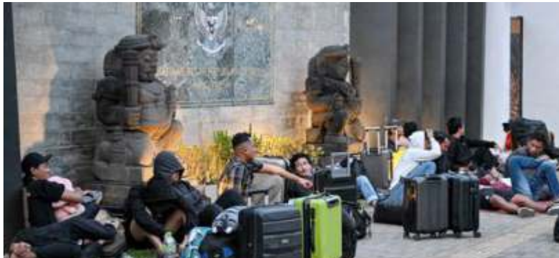
Para WNI dari berbagai wilayah di Kamboja sejak 16 Januari 2026. Tampak dalam foto, orang-orang berkumpul di depan KBRI di Phnom Penh, Kamboja, pada Rabu 21 Januari 2026.

B erdasarkan data Indonesia Anti Scam Center (IASC), hingga 14 Januari 2026 terdapat 432.637 laporan pengaduan dari masyarakat terkait penipuan. Anggota Dewan Komisiner OJK Bidang Edukasi dan Perlindungan Konsumen, Friderica Widyasari Dewi, mengungkapkan bahwa dari kasus-kasus tersebut, nilai dana masyarakat yang dilaporkan hilang mencapai Rp9,1 triliun.