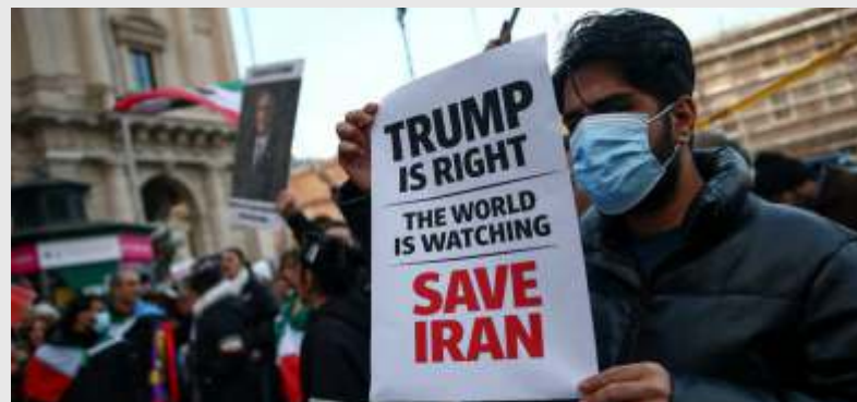
Seorang pria membawa poster terkait Presiden AS Donald Trump dalam unjuk rasa mendukung protes nasional di Iran, di Roma, Italia, 13 Januari 2026.

"Kali ini kita akan menganggap setiap serangan terbatas, tak terbatas, terarah, kinetik, apa pun sebutannya, sebagai perang habis-habisan