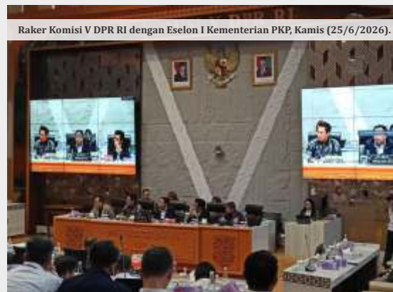
Raker Komisi V DPR RI dengan Eselon I Kementerian PKP, Kamis (25/6/2026).

Menteri Perumahan dan Kawasan Permukiman sekaligus