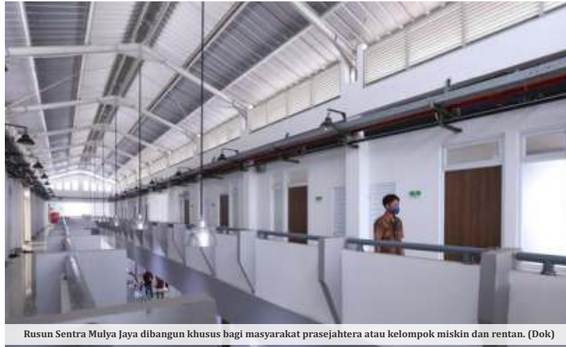
Rusun Sentra Mulya Jaya dibangun khusus bagi masyarakat prasejahtera atau kelompok miskin dan rentan. (Dok)

Ia menilai kewajiban tersebut perlu dimanfaatkan pemerintah