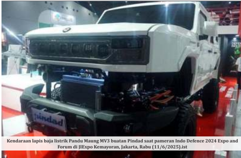
Kendaraan lapis baja listrik Pandu Maung MV3 buatan Pindad saat pameran Indo Defence 2024 Expo and Forum di JIExpo Kemayoran, Jakarta, Rabu (11/6/2025)

Pengembangan kendaraan nasional menjadi bagian dari ambisi pemerintah untuk memperkuat kemandirian industri otomotif Indonesia. Sebelumnya, Prabowo juga menyatakan Indonesia tidak hanya