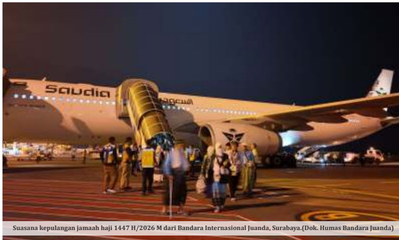
Suasana kepulangan jamaah haji 1447 H/2026 M dari Bandara Internasional Juanda, Surabaya.

Pernyataan itu menjadi respons atas usulan BPKH yang sebelumnya menyebut setoran awal haji idealnya dinaikkan dari Rp25 juta menjadi Rp35 juta. BPKH menilai tambahan dana tersebut dapat memperbesar dana kelolaan sehingga nilai manfaat