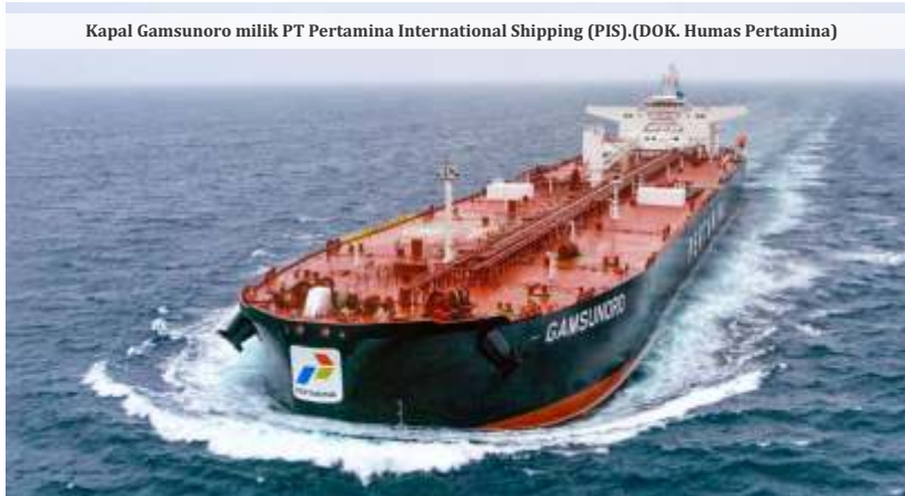
Kapal Gamsunoro milik PT Pertamina International Shipping (PIS).

Sebelumnya, kapal milik BUMN tersebut sempat tertahan di kawasan Teluk Persia sejak awal Maret 2026 akibat eskalasi keamanan yang memanas di wilayah perairan tersebut. Selat Hormuz sendiri dikenal sebagai salah satu jalur logistik minyak paling vital sekaligus paling rawan di dunia, di mana riak konflik