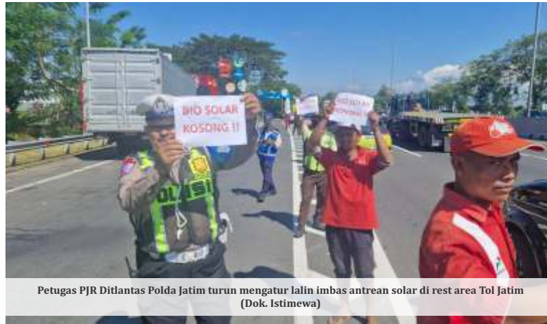
Peugas PJR Didantas Polda Jatim turun mengatur lalin imbas antrean solar di rest area Tol Jatim

Dalam Energy Forum yang disiarkan secara daring pada Kamis, (25/6/2023), Menteri Energi dan