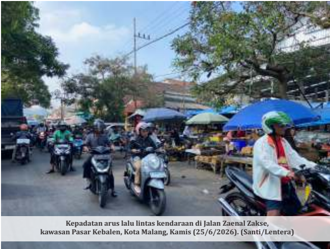
Kepadatan arus lalu lintas kendaraan di Jalan Zaenal Zakse, kawasan Pasar Kebalen, Kota Malang, Kamis (25/6/2026).

MALANG - Upaya Pemerintah Kota (Pemkot) Malang menata kawasan Pasar Kebalen diakui belum maksimal. Setelah dilakukan penertiban pedagang dan pedagang kaki lima (PKL) pada 6 Mei 2026 lalu, banyak yang kini kembali berjualan di badan Jalan Zaenal Zakse. Tak hanya itu, lapak dibuka melebihi batas waktu operasional yang telah ditetapkan.