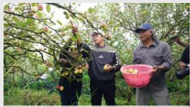
Wali Kota Batu, Nurochman melakukan panen apel bersama petani.

Selain itu, pemerintah juga didorong memberikan bantuan modal usaha, pupuk organik berkualitas, serta bibit apel unggul yang lebih tahan terhadap penyakit