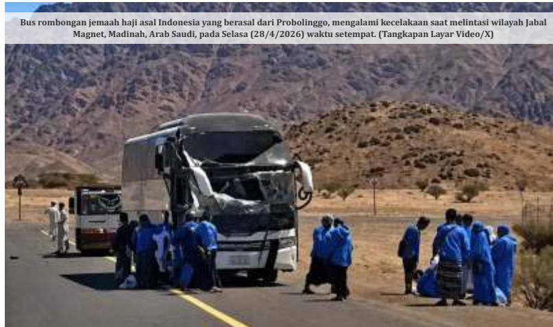
Bus rombongan jemaah haji asal Indonesia yang berasal dari Probolinggo, mengalami kecelakaan saat melintasi wilayah Jabal Magnet, Madinah, Arab Saudi, pada Selasa (28/4/2026) waktu setempat. (Tangkapan Layar Video/X)

menjelaskan bahwa kecelakaan terjadi saat salah satu kendaraan mendadak melintas di jalur bus sehingga memicu pengereman mendadak yang berujung tabrakan.