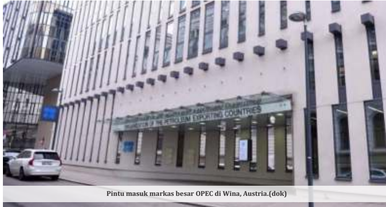
Pintu masuk markas besar OPEC di Wina, Austria.

OPEC sendiri merupakan organisasi negara pengekspor minyak yang berdiri sejak 1960, dengan anggota utama seperti Arab Saudi, Irak, Iran, Kuwait, dan UEA. Sementara OPEC+ adalah aliansi yang lebih luas, terbentuk pada akhir 2016, yang menggabungkan anggota OPEC dengan 10 negara produsen minyak