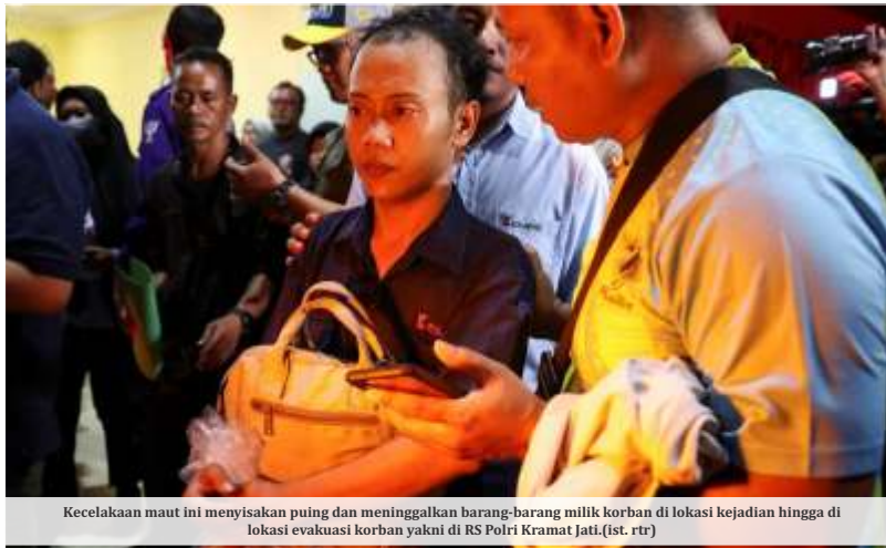
Kecelakaan maut ini menyisakan puing dan meninggalkan barang-barang milik korban di lokasi kejadian hingga di lokasi evakuasi korban yakni di RS Polri Kramat Jati.

Sementara itu, perlintasan tidak sebidang seperti flyover dan underpass