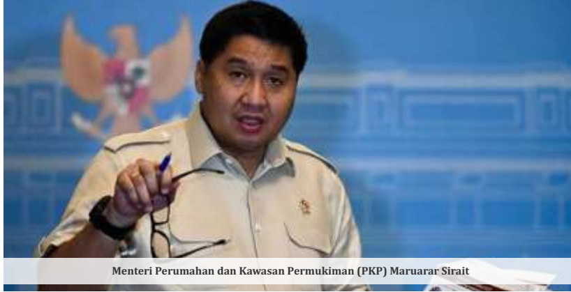
Menteri Perumahan dan Kawasan Permukiman (PKP) Maruarar Sirait

M enteri PKP Maruarar Sirait atau yang akrab disapa Ara menyebut pengunduran diri keduanya tidak berkaitan dengan persoalan internal maupun kinerja. Ia menegaskan, selama menjabat, kedua pejabat tersebut bekerja dengan baik. "Nggak ada masalah, mereka bagus kan," kata Ara saat ditemui di Jakarta, Rabu (29/4/2026).