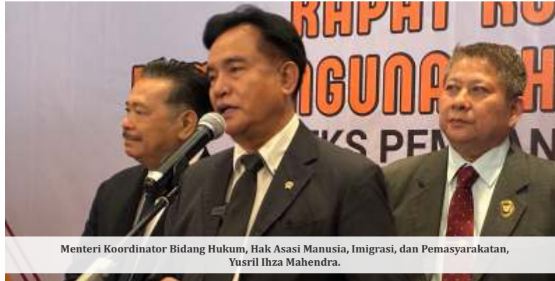
Menteri Koordinator Bidang Hukum, Hak Asasi Manusia, Imigrasi, dan Pemasaryakatan, Yusril Ihza Mahendra.

Namun, ia menilai peluang negosiasi ulang tetap terbuka jika proses legislasi tak kunjung rampung