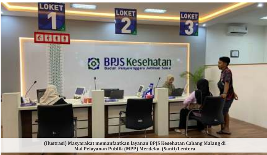
(Ilustrasi) Masyarakat memanfaatkan layanan BPJS Kesehatan Cabang Malang di Mal Pelayanan Publik (MPP) Merdeka.

MALANG - DPRD Kabupaten Malang menerima pengaduan adanya dugaan praktik 'upeti emas', dalam proses penentuan kerja sama fasilitas kesehatan (faskes) dengan BPJS Kesehatan setempat. Di sisi lain, BPJS menepis tuduhan tersebut.