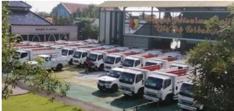
Sebanyak 57 Koperasi Desa Kelurahan Merah Putih (KDKMP) di Kabupaten Bojonegoro mulai menerima kendaraan operasional.

"Sudah ribuan yang telah disalurkan di Koperasi Desa yang